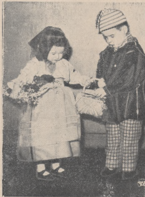
Na zdjęciu — dzieci z Normandii w swych regionalnych strojach.