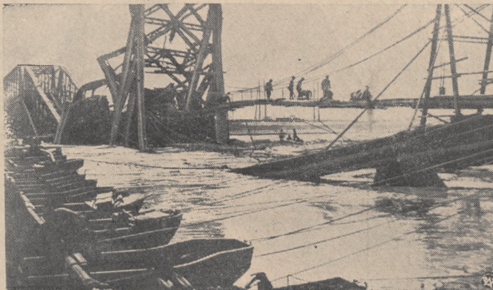
Na zdjęciu fragment z prac przy odbudowie olbrzymiego mostu żelbetowego na rzece Żółtej w Chinach, zniszczonego całkowicie w wyniku działań wojennych chińsko-japońskich.