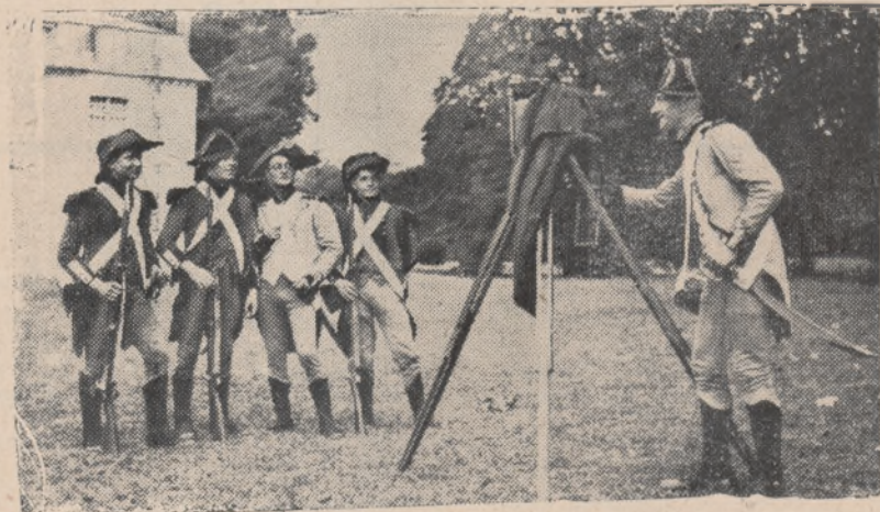
Grupa żołnierzy w mundurach z epoki Ludwika VII.

Tak Polskę dźwigać należy, jak dźwiga młodzież junacka. Pracą i ofiarnością.