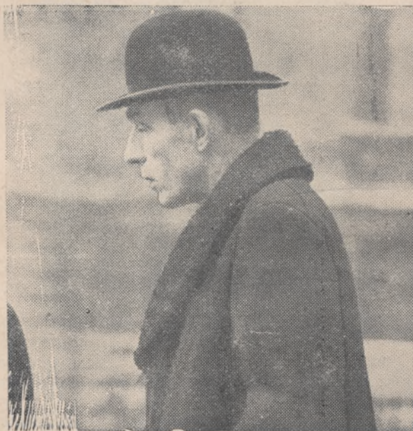
Premier Wielkiej Brytanii Neville Chamberlain.

„Jestem przekonany, że jeśli Liga odrzuci maskę i udanie,