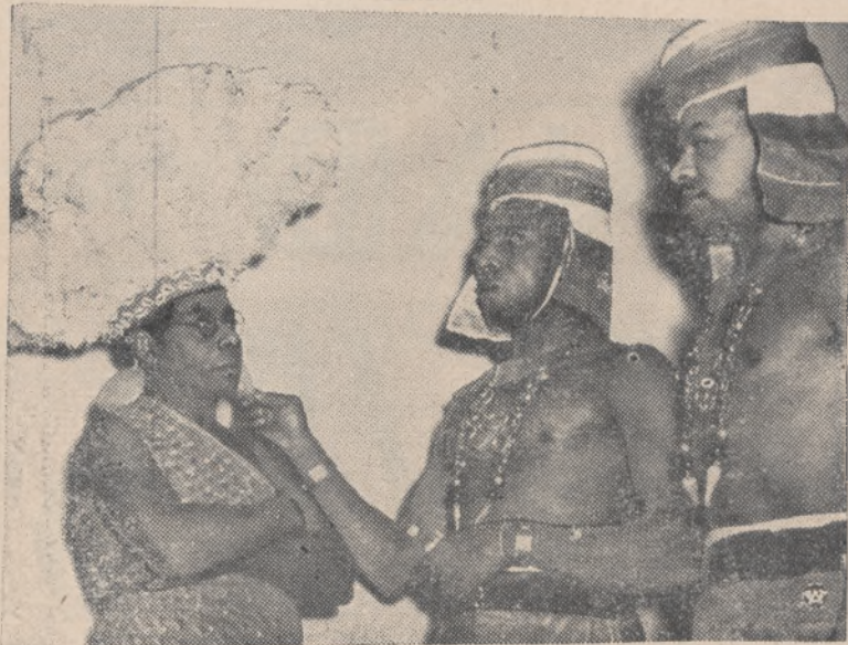
Na zdjęciu grupa murzyńców-artystów, którzy na wystawie samochodowej w Berlinie produkują się w wodewilu „Kisuheli”.