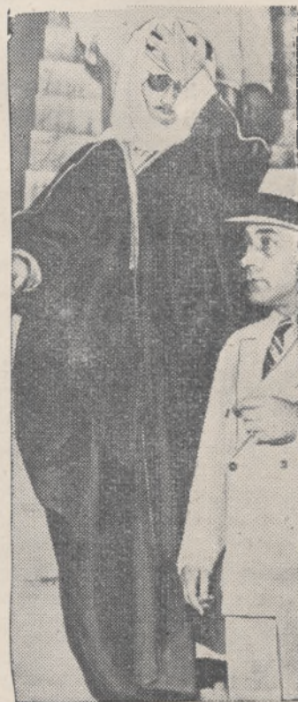
Hadż Amin Effendi Al Husseini.

Bezwzględnemu fanatykowi, nienawidzącemu Anglików i równocześnie — śmiertelnemu wrogowi żydostwa i idei żydowskiej siedziby narodowej w Ziemi Świętej dano w ten sposób w ręce niesłychanie szeroki zakres władzy, wpływów i możliwości wszelkiego rodzaju.