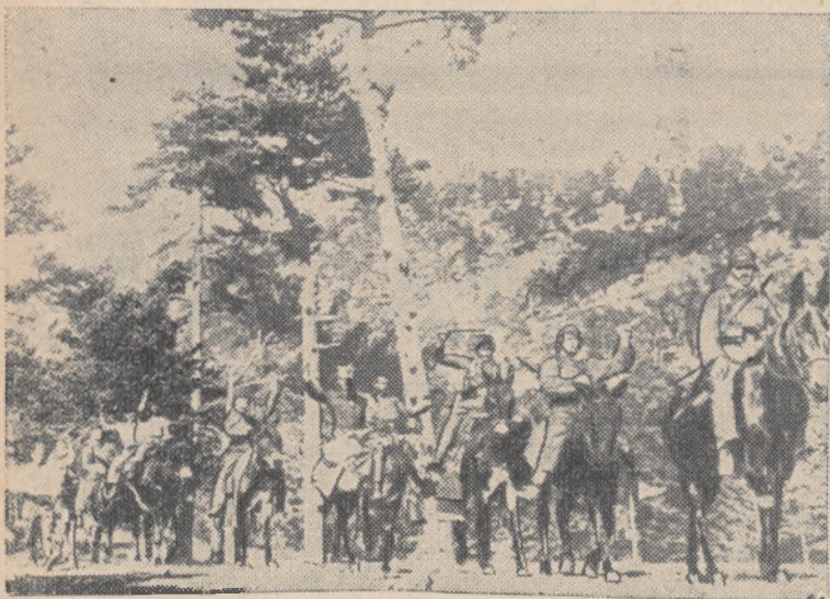
Szwadron czerwonej kawalerii.

Jeszcze niżej od chłopów, co się tyczy warunków życia i traktowania, postawiona jest duża klasa ludzi, którą tworzą zesłańcy, więźniowie w obozach koncentracyjnych i skazani do ciężkich robót katorżnicy. Nie jest tu przy tym mowa, jakby ktoś może myślał, o tysiącach lub setkach tysięcy tych nieszczęśliwców, ale o milionach ludzi, którym dyktatura sowiecka zgotowała los, jaki w krajach innych nie czeka nawet najgorszego zbrodniarza.