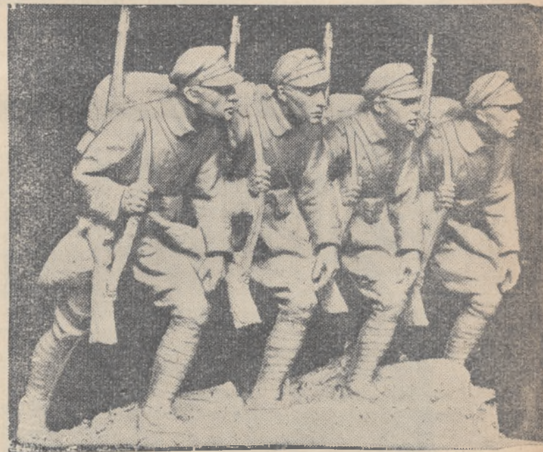
„Czwórka” — rzeźba prof. Raszki.

Młodzi są pewni, że zrozumienie i realna współpraca silnych narodów, w poczet których zalicza się i Polska, przyczyni się do ugruntowania i zapewnienia pokoju w Europie.