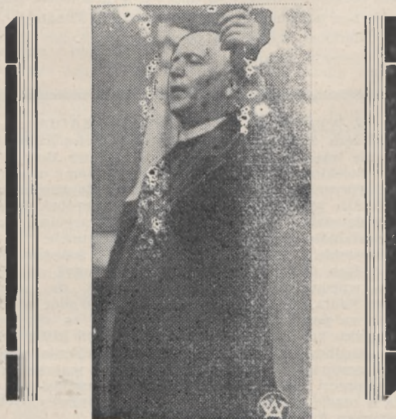
Ks. Andrzej Hlinka — wódz autonomistów słowackich w Czechosłowacji.

Paragraf 3 stwierdza, że na terytorium Słowacji ustanawia się krajowa przynależność słowacka. Warunkiem otrzymania przynależności słowackiej jest prawo swojszczyzny jednej z gmin słowackich.