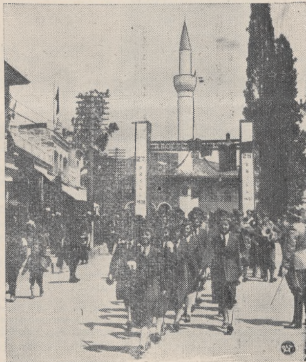
Wojskowy oddział kobiecy, stworzony przez jedną z sióstr króla Albanii.

Nie oddamy ani piędzi ziemi polskiej i nie pozwolimy, by uszczuplono nasze granice, do których mamy prawo.