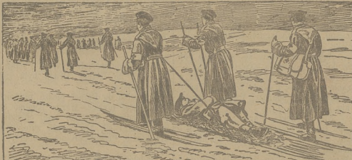
Transport rannych żołnierzy rosyjskich w Mandżurji. Rosyianie rannych swoich ze względu na trudność transportują na nartach (ski).

Akcya króla Edwarda VII ma wszelkie widoki powodzenia. Koszta wojny poniosą Chiny i Korea — to nie ulega wątpliwości. Tymczasem jednak musi się jeszcze rozgrywać wojna, musi doprowadzić