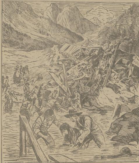
Strasza katastrofa kolejowa w Ameryce. Patr. Ze świata: Kron. ilustr.

Co to takiego? Zarosła, jak każde inne; sączy się tam jakiś strumień, wydaję głuchym szmer i nic więcej. Aha, jest. Z za-