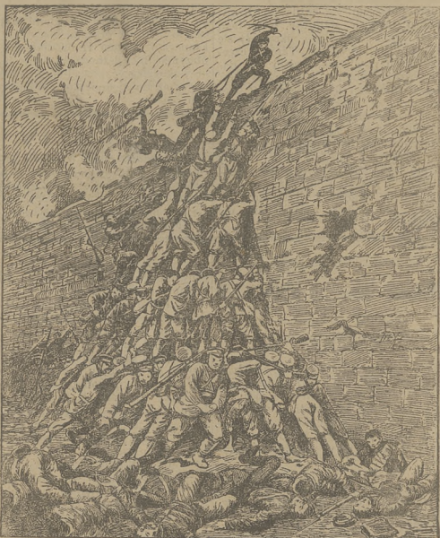
Japończycy zdobywają szturmem fort zaredutny: Piramida ludzka.