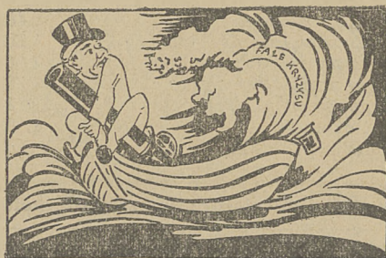
Fala kryzysu goni. Trzeba ratować armaty

We Francji jest 1.055.174 mogił wojennych, w Anglii — 725.000, w Austrii — 120.000, w Rumunji — 400.000, w Czechosłowacji — 93.000, w Polsce (różnych narodowości) 1.300.000 i t. d. Kiedy świat pobrzękuje szabelką, warto przypominać te liczby.