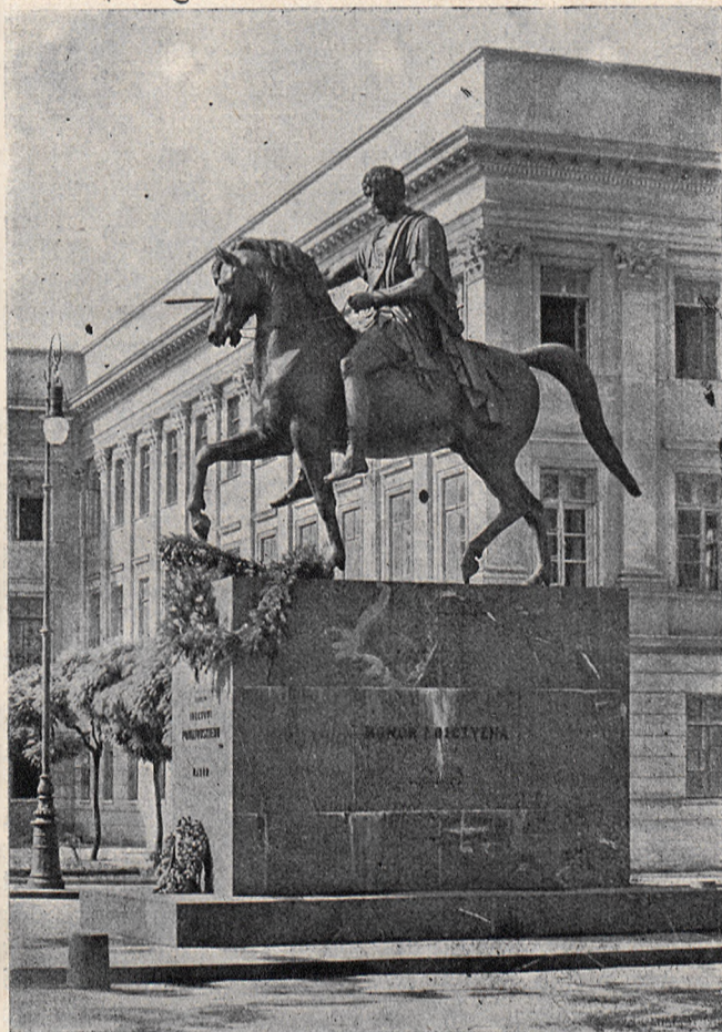
Monumento de Princo Józef Poniatowski.

Alvokas vin la vivo kaj la morto — lulilo kaj tombo — eble rebrilo de l' Mekko kaj ombro de