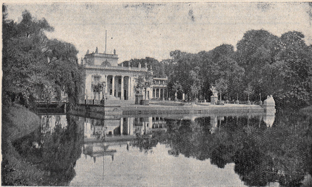
Palaco en parko Łazienki.

Se pravis maljunaj Romanoj en sia kredo, ke ekzistas io, kio no-