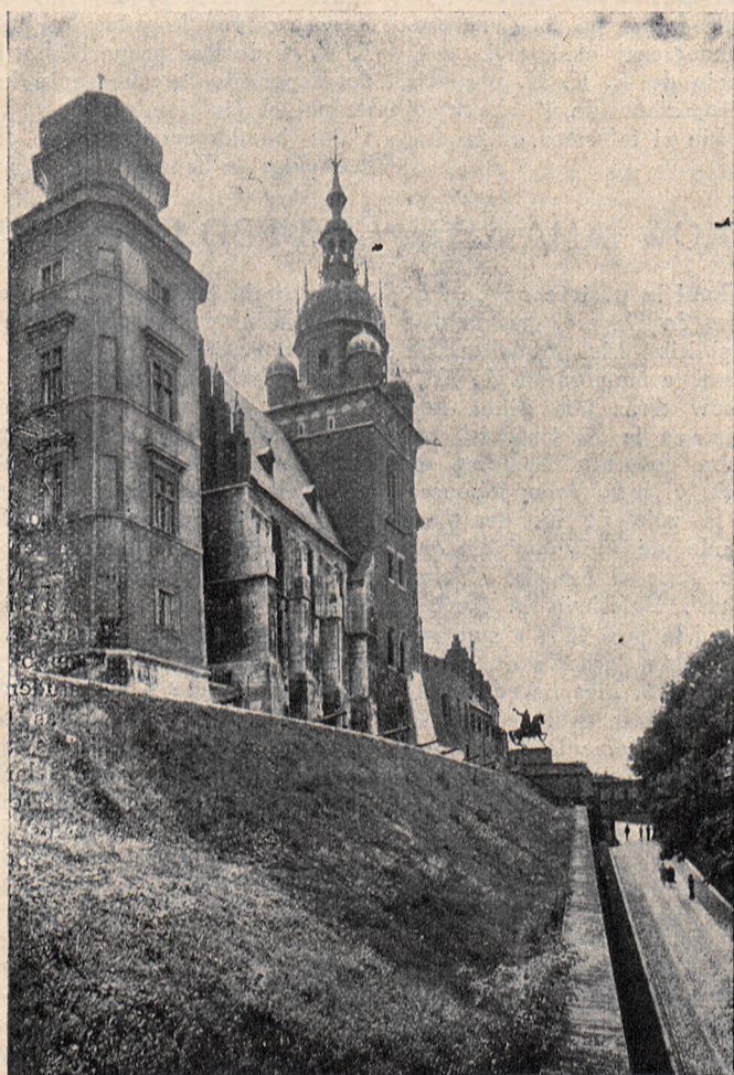
Wawel. Enirejo kaj monumento de Kościuszko.

berto, S-ta Andreo, S-ta Nikolao. En la XIII. jc. la ordenoj de Franciskanoj kaj Dominikanoj komencis la konstruadon de siaj preĝejoj kaj monaĥejo, kaj samtempe estis konstruata sur la ĉefplaco la belega paroĥa preĝejo de S-ta Mario. En la XIV. jc. la reĝo Łokietek igis konstrui