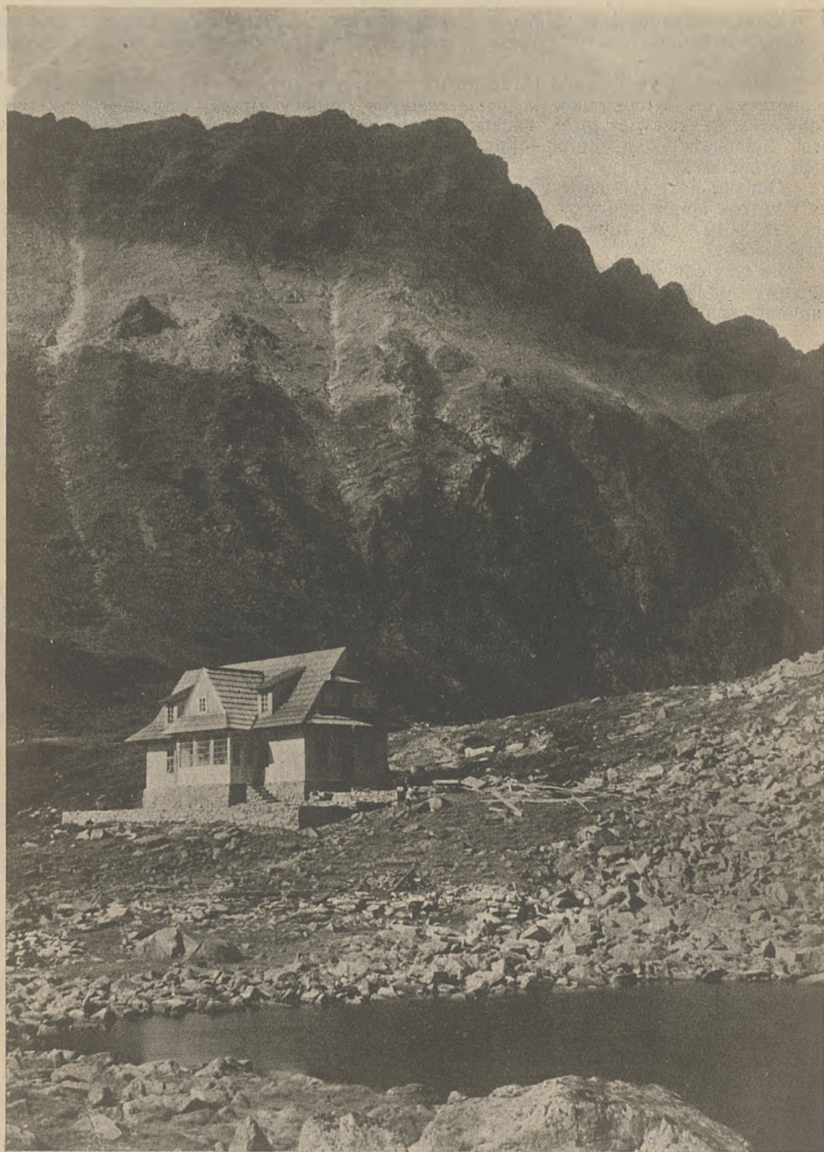
Schronisko Oddziału Zakopiańskiego P. T. T. im. Leopolda Świerza w Dolinie Pięciu Stawów.