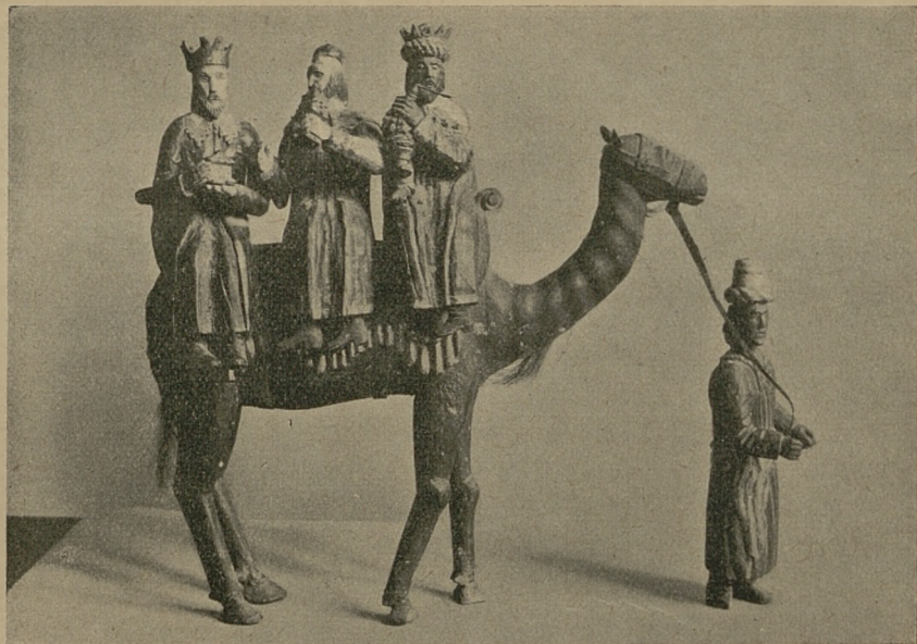
Trzej Królowie, rzeźba ludowa z Zawoi pod Babią Górą. (Okaz w Muzeum Etnograficznym na Wawelu).

Uczenica z II kl. gimnazjum żeńskiego w Wadowicach przysłała do Redakcji „Orlego Lotu“ obszerny opis roku obrzędowego, na który składają się: Święta Godnie, Z szopką, Ostatni dzień Starego Roku, Nowy Rok, Zapusty, Zaczki, Wielkanoc, Sobótka, Dożynki, Andrzejki oraz Wesele. Z interesującej pracy młodej krajoznawczyni umieszczamy rozdział zatytułowany „Z szopką“.