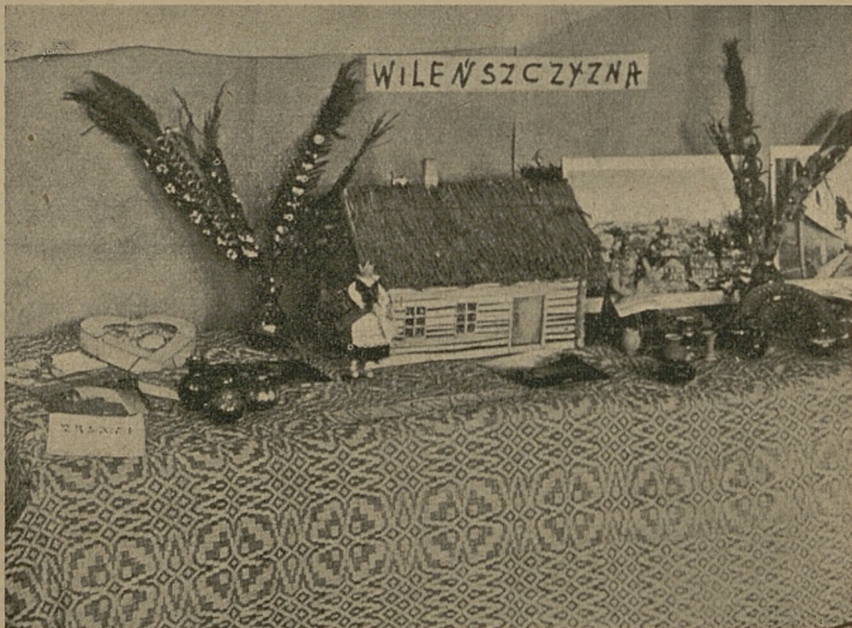
Stoisko Wileńszczyzny na wystawie Koła krajoznawczego w Rabce.