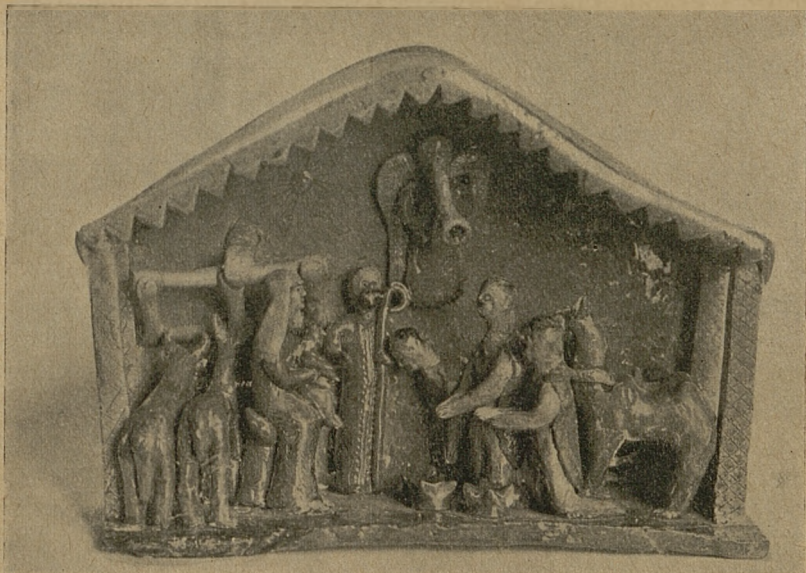
U źlóbka — ceramika ludowa Stanisława Kosiarskiego w Ilży.