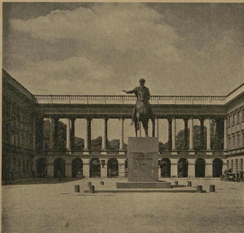
Pomnik Księcia Józefa w Warszawie.