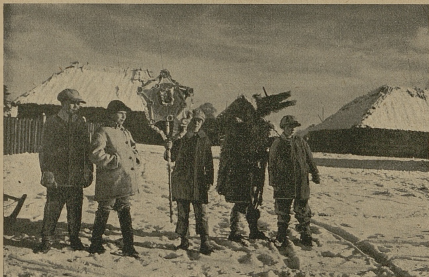
Sliczne zdjęcie kolędników, wykonane przez p. Józefa Górowicza z Lutyńska w pow. stolińskim na Polesiu.

Po wieczerzy w powiecie postawskim i wilejskim ze stołu nie sprzątają, zostawiając resztki jedła dla zmarłych. W powiecie dziśnińskim kładą łyżkę kucji z zewnątrz okna, wierząc, że dusze zmarłych przychodzą z powiewem wiatru. W powiecie wołkowyskim lud mniema, że dusze zmarłe, które przychodzą w noc wigilijną, pozostają w domu aż do Trzech Króli.