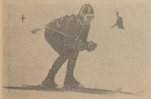
Młodzi zjazdowcy Śląska poczynili dalsze postępy.

pozycja dochodów z imprez jest znaczna z wpływem z Telewizji Śląskiej za udostępnienie transmisji z kilku zawodów Okręgu oraz udostępnienie posiadanych materiałów filmowych. Koszty organizacji jubileuszu i oczywiście w lepszej oprawie zawodów jubileuszowych, pokryte zostały w całości z wpływów.