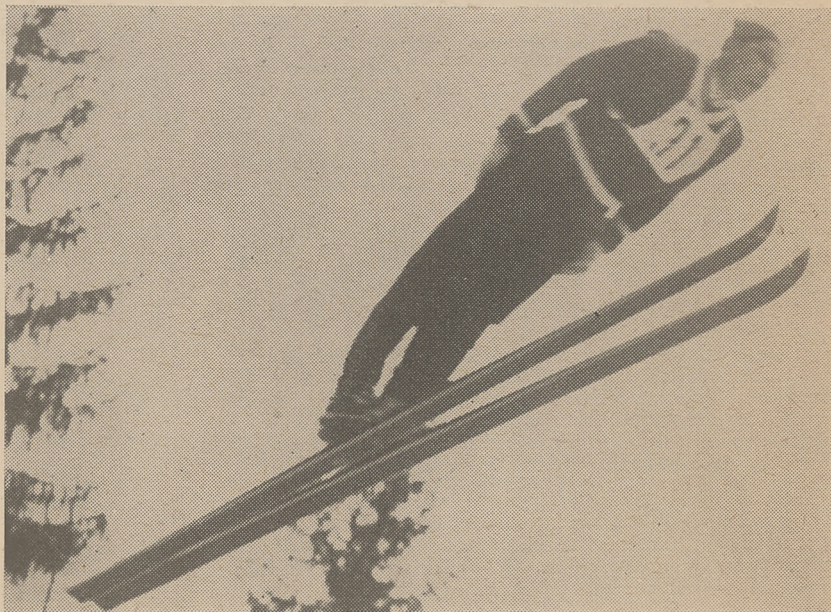
Najlepszy narciarz Śląska — Antoni Wieczorek (LZS Szczyrk).

DZIEWCZĘTA „A” (3 KM) — 1) Warzuta (MKS Bielsko) — 14,48; 2) Szalbót (Barania) — 15,06; 3) Wywiad (BBTS) — 15,32; 4) U. Marek (BBTS) — 15,33; 5) Chraścina (Start) — 15,30; 6) Klima (MKS Bielsko) — 15,51. DZIEWCZĘTA „B” (5 KM) — 1) Ligocka (Górniki) — 23,45; 2) Legierska Anna I (Górniki) — 24,11; 3) Paluch (BBTS) — 24,34; 4) Zuromska (BBTS) — 25,13; 5) Płonka (MKS Bielsko) — 25,55; 6) Puczek (Kuźnia) — 26,10. KOBIETY (5 KM) — 1) Heller (LZS Szczyrk) — 24,00; 2) Michałek (Beskid Istebna) 25,18; 3) Bujok (Start) — 26,12; 4) Pilch (Start) — 26,39; 5) Zawada (Beskid Istebna) — 26,51. KOBIETY