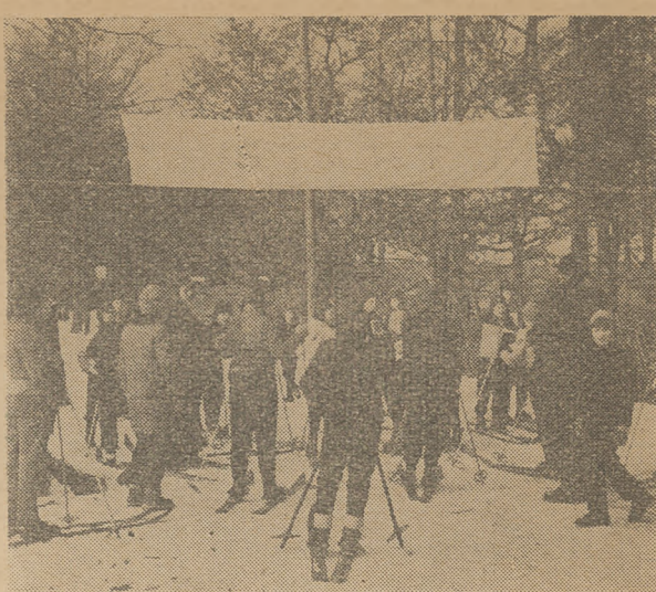
To zdjęcie przesłano nam z Lublińca. Przedstawia ono start do zawodów o odznakę. Jednak na nizinach było trochę śniegu i można było urządzać zawody.

Prowadzona z inicjatywy działaczy naszego Okręgu akcja zdobywania Szkolnych Odznak PZN, święciła na Śląsku pełny triumf. W zawodach tych startowało wg. dotychczas otrzymanych danych 11435 dziewcząt i chłopców, z których 1109 zdobyło odznaki szkolne. Już te cyfry świadczą o kolosalnych możliwościach tej nowo wprowadzonej do kalendarzyka narciarskiego imprezy, która ma przed sobą wielką przyszłość. Przecież tylko nieliczne