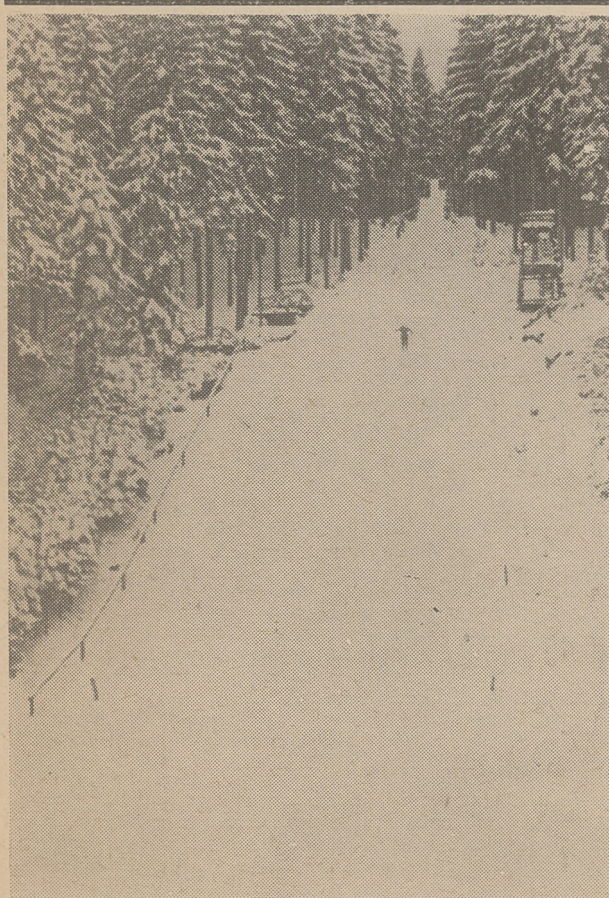
Średnia skocznia w Wiśle - Głębcach.

Do uregulowania pozostają w dalszym ciągu sprawy inwestycyjne w Radzie Wojewódzkiej LZS. Instytucja ta — podobnie jak do ub. roku Okręg — nie ma szczęścia do pracownikom inwestycyjnych, którzy zamiełdubują w sposób oczywisty sprawy dokumentacji inwestycji narciarskich, bez których nie da się nic zdziałać. W przyszłości zarząd Okręgu będzie musiał udzielić wydatnej pomocy, bo przecież i w jego interesie leży postęp inwestycji znajdujących się w rękach LZS. Pocięszająca wiadomość, iż zakończono wreszcie dokumentację skoczni na szczycie Skrzycznego. Wprawdzie brak na te prace pieniędzy, ale jest nadzieja, że Okręg uzyska środki w GKKFiT. Przed