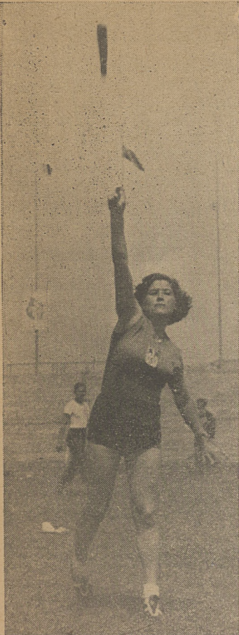
Stańko rzuca granatem