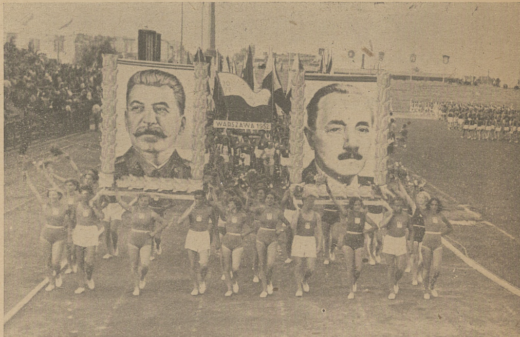
Rozpoczęła się defilada uczestników II Akademickich Mistrzostw Polski w Warszawie. Bieżnią stadionu maszeruje ponad 1700 młodych zawodników i zawodniczek. Czoło kolumny otwiera grupa, niosąca dwa wielkie portrety Generalissimusa STALINA i Prezydenta BIERUTA.

Nowym rekordzistom składamy gratulacje, życząc im dalszych sukcesów. Wzywamy jednocześnie pływaczki i pływaków, uczestników II AMP do szlachetnego współzawodnictwa: pobić wszystkie zeszłoroczne rekordy, osiągnąć wyniki, jak najbardziej zbliżone do rekordów Polski!