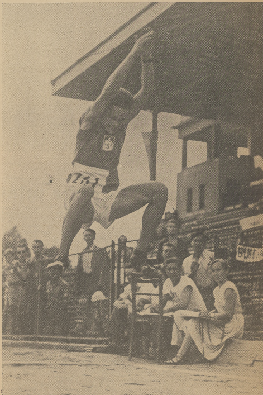
7,12 m — najdłuższy skok Mistrzostw (Sak)

Spotkania w siatkówce męskiej przybierają coraz bardziej na zaciętości. AWF po zwycięstwie nad WSWF Kraków 3:1, wydaje się być kandydatem do tytułu mistrzowskiego, mimo, że nie grają w niej kadrowicze. Spotkanie AWF — WSWF Kraków , za-