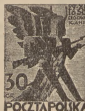
1930 r. Grochów 29. XI. 1830 r. 15—30 gr.