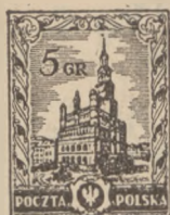
1926 r. Obrazkowe 1—45 gr. bez odmian