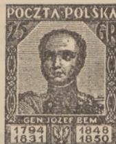
1928 r. Bem 25 gr.

453—4 . . . . . 2 4,75 8,— dto. na oryg. liście RR! —, — 18,75