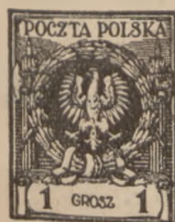
1924 r. Orzeł i Wojciechowski 1—50 gr. i 1 zł. bez odmian

385—92 . . . . . 8 2,— 1,50 393—94 . . . . . 2 7,50 9,75