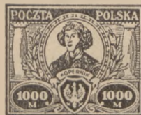
1923 r. Kopernik, Konarski 1,000—5,000 Mk. bez odmian