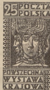
1929 r. Powszechna Wystawa Krajowa 25 gr.