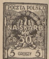
1925 r. Na Skarb 1+50—50+50 gr.