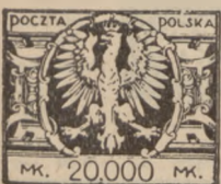
1924 r. Orzeł 10,000 do 2,000,000 Mk.

385—92 . . . . . 8 2,— 1,50 393—94 . . . . . 2 7,50 9,75