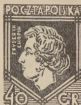
1927 r. Chopin, Piłsud- ski, Mościcki 20—40 gr.