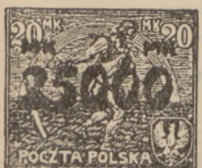
1923 r. Prowizorja 10,000 do 100,000 Mk. bez odmian