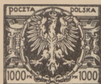
1921-23 r. Orzeł 25—2,000 Mk.