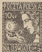
1927 r. Na Oświatę 10—20 gr.