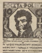
1927 r. Kaczkowski 10—40 gr.