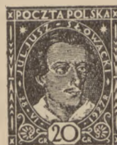
1927/28 r. Słowacki i Pił- sudski 20 i 25 gr.