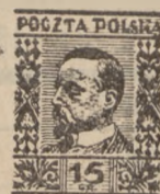
1929/30 r. Orzeł, Portrety, 5 gr. — 1 zł.