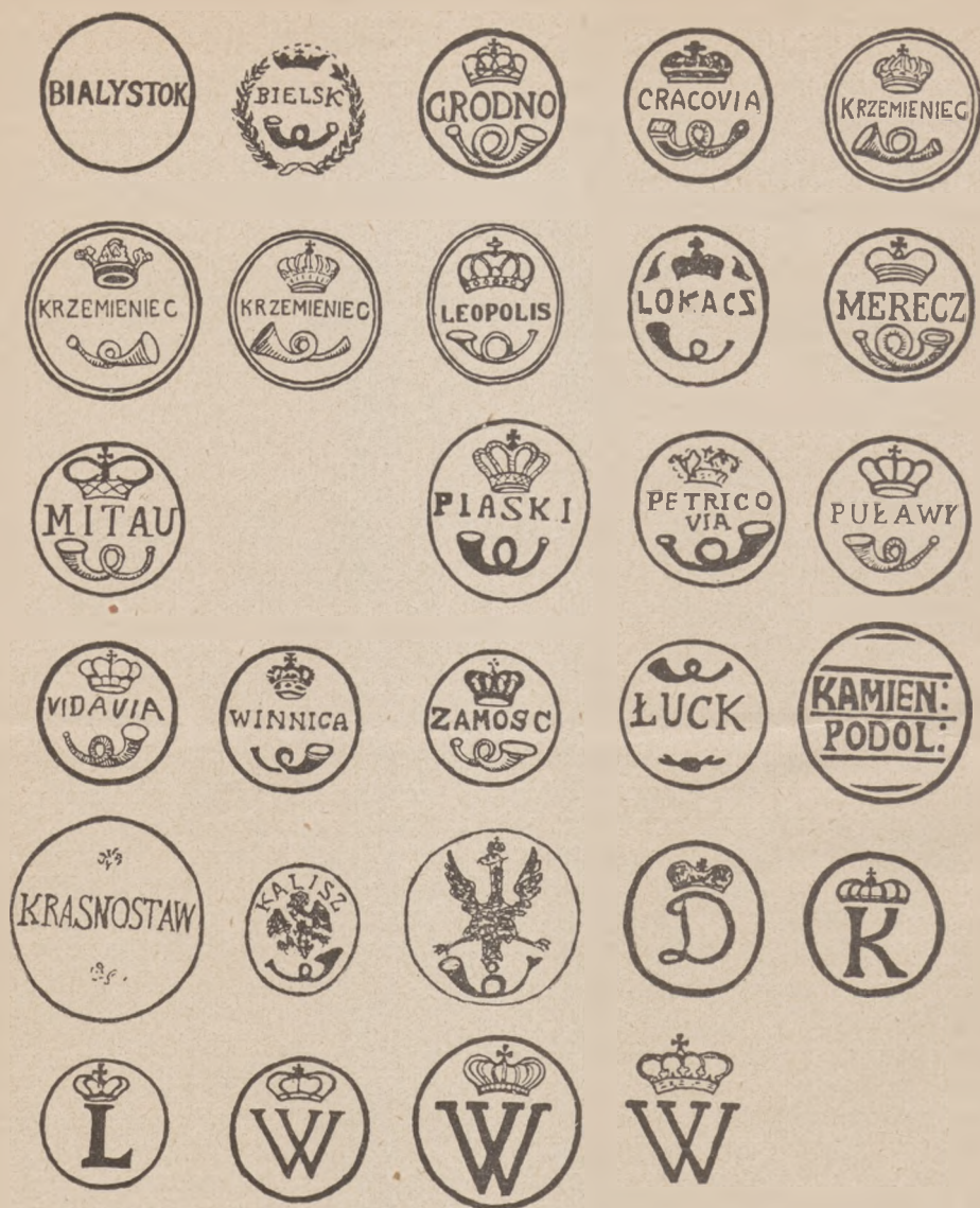
TABLICA 3. Stemple tuszowe nadawcze. 1. Białystok 1787 r.; 2. Bielsk Podlaski 1779/84 r.; 3. Grodno 1785/93 r.; 4. Kraków 1773/83 r.; 5. Krzemieniec I data nieznaną. 6. Krzemieniec II 1788/89 r.; 7. Krzemieniec III 1790 r.; 8. Lwów (Leopolis) data nieznaną przed 1772 r.; 9. Łokacz data nieznaną koło 1790 r.; 10. Merecz 1786/89 r.; 11. Mitawa 1783 r.; 12. Piaski 1791 r.; 13. Piotrków (Petricovia) 1790 r.; 14. Puławy 1787/93 r.; 15. Wida- wa 1796 r.; 16. Winnica 1778/89 r.; 17. Zamość 1768/72 r.; 18. Łuck 1789 r.; 19. Kamie- niec Podolski 1778/81 r.; 20. Krasnostaw 1792 r.; 21. Kalisz 1787 r.; 22. Nadworny Poczta- amt w Warszawie na Zamku 1791 r.; 23. D = Dubno 1788/90 r.; 24. K = Kraków 1786/92 r.; 25. L = Lublin 1780/82 r.; 26. W = Warszawa I 1778/87 r.; 27. Warszawa II 1783/87 r.; 28. Warszawa III 1787/93 r.