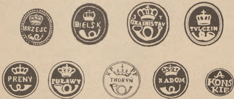
TABLICA 2. Pocztowe pieczęcie lakowe znane z odcisków tuszowych (użyte zamiast stempli nadawczych: 1. Brześć 1781 r.; 2. Bielsk Podlaski 1778 r.; 3. Krasnystaw 1780/82 r.; 4. Tulczyn 1788 r.; 5. Preny 1789/93 r.; 6. Puławy 1780 r.; 7. Toruń data nieznana; 8. Radom 1778 r.; 9. Końskie 1788 r.

Przed wprowadzeniem właściwych stempli nadawczych w niektórych pocztamtach używano pieczęci lakowych do oznaczania nadawanych listów, odciskując je czarną farbą zamiast stempli. Tak wykonane odciski pieczęci lakowych różnią się od właściwych stempli tym, że wykazują biały rysunek