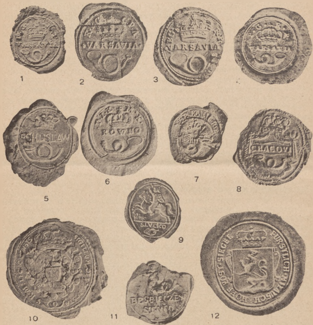
TABLICA 1. Pieczęcie lakowe znane z odcisków w laku: 1. Warszawa 1762 r.; 2. Warszawa 1775 r.; 3. Warszawa 1780 r.; 4. Warszawa 1788 r.; 5. Bohuslaw 1788 r.; 6. Kowno 1783 r.; 7. Kamieniec Podolski 1773 r.; 8. Kraków (Cracovi) z 1793 r.; 9. Słuck 1788 r.; 10. Pieczęć urzędowa pocztamtu we Lwowie 1794 r.; 11. Pieczęć cenzury listowej z 1794 r.; 12. Pieczęć pocztamtu w Mitawie 1767 r.

częście te przedstawione na tabl. 1 wraz z podaniem roku wyciśnięcia różnią się między sobą w drobnych szczegółach wykonania jak: wielkością i wyglądem koron, napisów oraz trąbek; z większych różnic możemy zaznaczyć ozdobny pasudament na pieczęci krakowskiej, na którym jest umieszczony napis i trąbka, Pogoń zamiast korony jako herb Litwy w pieczęci Słucka, oraz wschodzące słońce herb Podola w pieczęci Kamieńca.