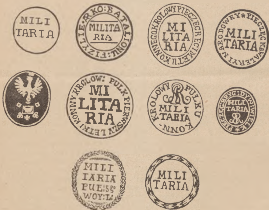
TABLICA 5. Stemple zwolnienia od opłaty porta przesyłek urzędowych wojskowych. (Objaśnienia w tekście).

Na podstawie uniwersałów Wielkich Hetmanów Koronnego Franciszka Xawerego Branickiego i Litewskiego Michała Ogińskiego, wydanych dla Korony dnia 28 maja a dla Litwy dnia 18 czerwca 1775 r. wszelkie listy i przesyłki w sprawach wojskowych były zwolnione od opłacania porta, jednakowoż musiały być oznaczone stemplem „MILITARIA“ zawierającym zwykle także i oznaczenie dotyczącej formacji wojskowej. Jedynie tylko stempel Militaria kancelarii królewskiej nie miał żadnych oznaczeń tabl. 5).