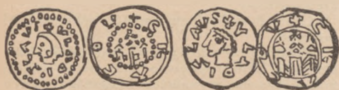
rysunek 4 i 5

s. o. w zwyczajnym albo perłowym obwodzie brama o trzech wieżach spiczastymi daszkami nakrytych i krzyżami u góry zakończonych. W otoku + CRACOV. Na niektórych okazach w miejscu napisu miasta znajduje się napis VOCEIKVS albo VO + VO + VO. Są znów inne z odwrociem beznapisowym których otok kilkaspółśrodkowych obwodów wypełnia.