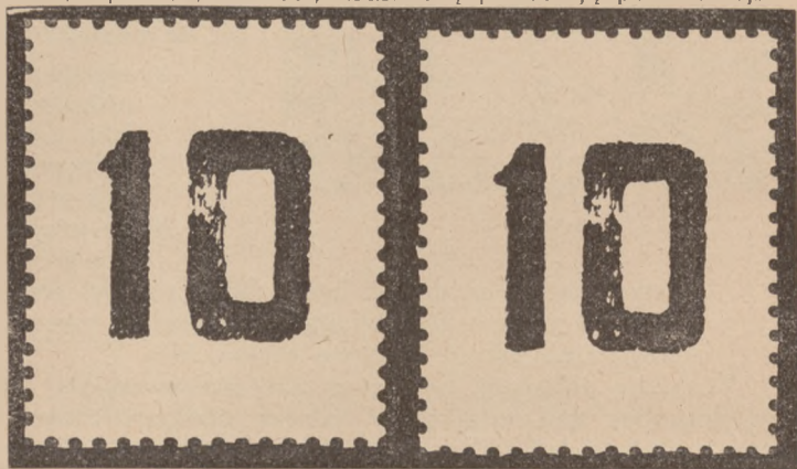
Rycina 1. (Nadruk 14 znaczka)

Niestety samych smug występujących na powierzchni cyfr „10” nie da się zreprodukować w druku kreskowym, reprodukcja zaś w druku siatkowym nawet przy dużym powiększeniu zacierałaby ich ostrość.