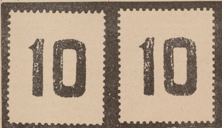
Rycina 2. (Nadruk 15 znaczka)