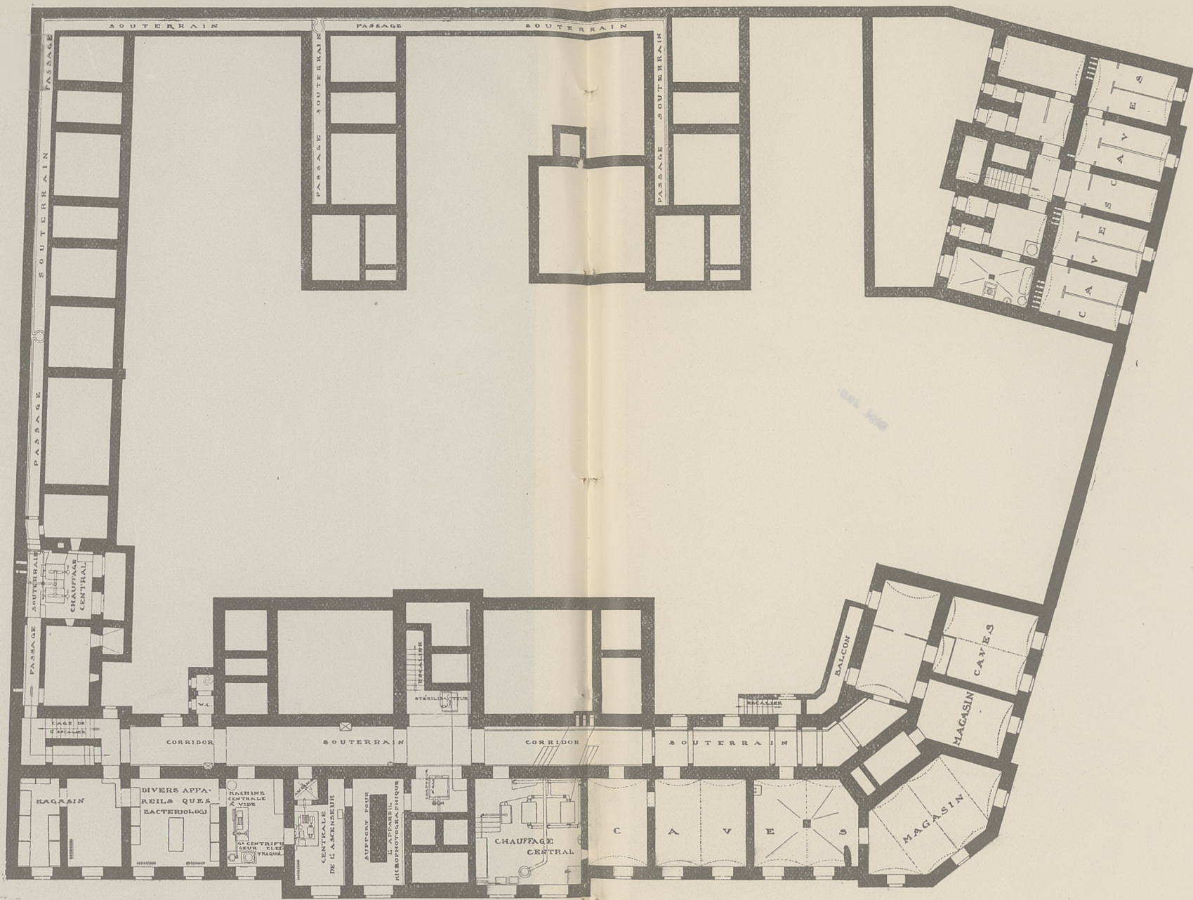
SOUS - SOL