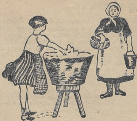
Zalety mydła „Społem” są widoczne. Mała dziewczynka, przyszła gospodyni domu doskonale sobie daje radę z praniem.

Odezwa, o której tu mowa, przeczytana na każdym walnem zebraniu spółdzielni wiejskich, powinna wywrzeć doskonałe i bardzo dodatnie wrażenie. Pobudzi do czynu i sprowadzi otuchę w serca ludzi strapionych.