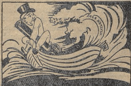
Fala kryzysu goni. Trzeba ratować armaty

We Francji jest 1.055.174 mogił wojennych, w Anglii — 725.000, w Austrii — 120.000, w Rumunji — 400.000, w Czechosłowacji — 93.000, w Polsce (różnych narodowości) 1.300.000 i t. d. Kiedy świat pobrzękuje szabelką, warto przypominać te liczby.