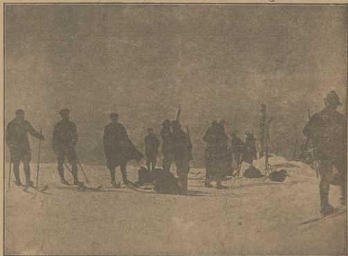
W Zakopanem... Mimo siarczętych r. różów grupa sportowców używa ślizgawki na nartach (czerwiane łyżwy)

Po tem przemówieniu objął przewodnictwo ze starszeństwa sędziwy książę Ferdynand Radziwiłł, prezes berlińskiego Kola Polskiego. Na posiedzeniu następnem, w 4 dni później, Marszałkiem Sejmu został wybrany pos. Woiciech Trampeżyński.