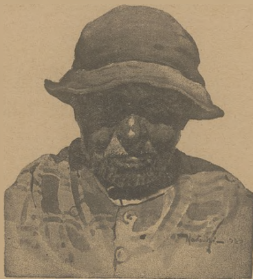
Rybak z Gdyni, który cały żywot spędził na morzu i nie jedną widział burzę.

rzyło się kilka wybuchów benzyny. Straż z trudem zdołała ocalić sąsiednie domy od ognia. W składach spłonęły wagony, elektrowozy i różne zapasy. Szkody wynoszą około 600.000 marek.