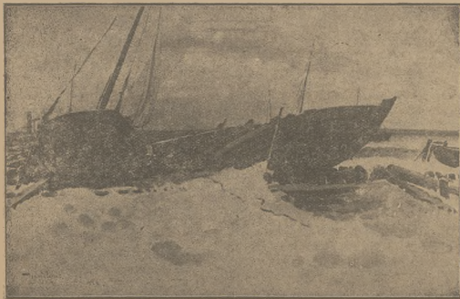
Morze zamarzło—łodzie meruchomo leżą na brzegu

Wszelkie poszukiwania policyjne dotąd nie dały żadnego wyniku.