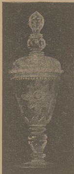
Z Moskwy — do Polski wrócił pamiątkowy puchar króla Jana Sobieskiego

W dziesiątą rocznicę Sejmu składam mu życzenia, aby zawsze był przedstawicielstwem godnym wielkiego Narodu. (Okłaski).