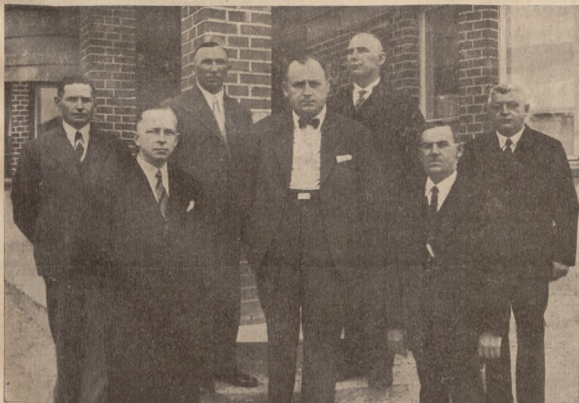
Zarząd Targów i Wystaw Meblowych w Swarzędzu.