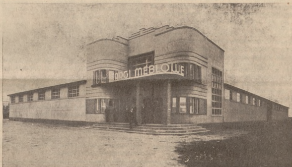
Główna Hala Targów Meblowych w Swarzędzu

Miasto nie wielkie, bo liczące około 6000 mieszkańców, ma swoją przeszłość historyczną. Wprawdzie o przeszłości tej pierwotnej osady nie