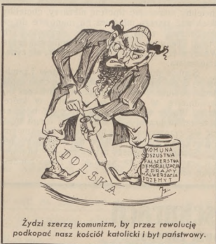
Żydy szerzą komunizm, by przez rewolucję podkopać nasz kościół katolicki i być państwowymi.

Tuczy się tysiące żydowskich dyrektorów, adwokatów, lekarzy, literatów, nawet polityków, dziennikarzy, tuczy się i pęcznie sadłem na polskiej ziemi. — W wielkich i potężnych machach żydowskich toną biedne reszki naszych polskich obywateli — dusi się naród polski — jest uciskany przez tych zachłanych pasożytników. Nigdy nie możemy się ludzi, że żydzi dobrowolnie wemigrują z Polski. — Oni sami otwarcie i śmiało mówią narodowi naszemu, że „byliby głupi wędrować do jakichś tam kolonii”. Gdy miliony Polaków tują się po całym świecie, tymczasem żyd pasożyt zagnieździł się na polskiej ziemi, dąży do stworzenia z niej Judei — Polski chciałby wywołać i stworzyć ferment w naszym Państwie. — Nie uda ci się żydowski pasożyt zrobić z Polski Hiszpani — Naród Polski jest gotowy. etnia