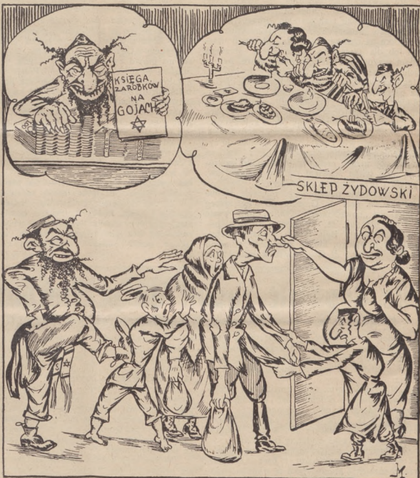
Jak ślepych baranów wciągają żydzi głupich, ciemnych wojtów do swoich sklepów — drogą, niedaną tandetę!