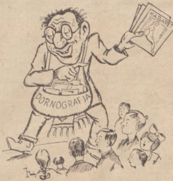
Żydzi i moralność, rozrywka ze scen kabaretów i renty, przedstawia żyda dancęcego świat.

Dancangi kabarety i nocne lokale, gdzie piękne bywały kobiety, stały były odwiedzane przez Zajczyka, który w tych sferach zdobywał sympatię i zaufanie upatrzonych ofiar.