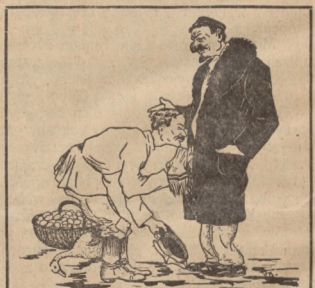
Polak żydowi czapkuje.

Chwila w kierunku gosu zaszytanego, zna-