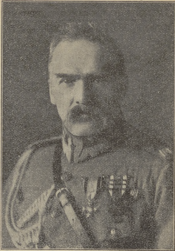
Portret ministra spraw wojskowych marszałka Józefa Piłsudskiego zatwierdzony dla wojska. Format portretu 38×51 cm. Cena 2. 80