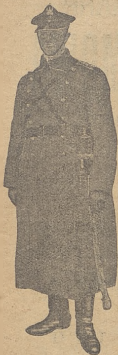
Jedna z figur na tablicy 1. \frac{1}{3} naturalnej wielkości.