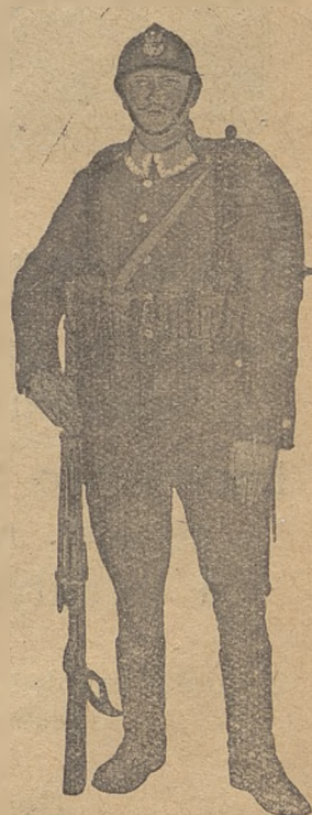
Jedna z figur na tablicy 1. \frac{1}{3} naturalnej wielkości.

Tablice te w sposób poglądowy zapoznają ze szczegółami umundurowania i ekwipunku naszego wojska, ze sposobami jego noszenia oraz oznakami osób wojskowych. To też będą one dużą pomocą przy wyszkoleniu zarówno wojska, jak i oddziałów przysposobienia wojskowego.