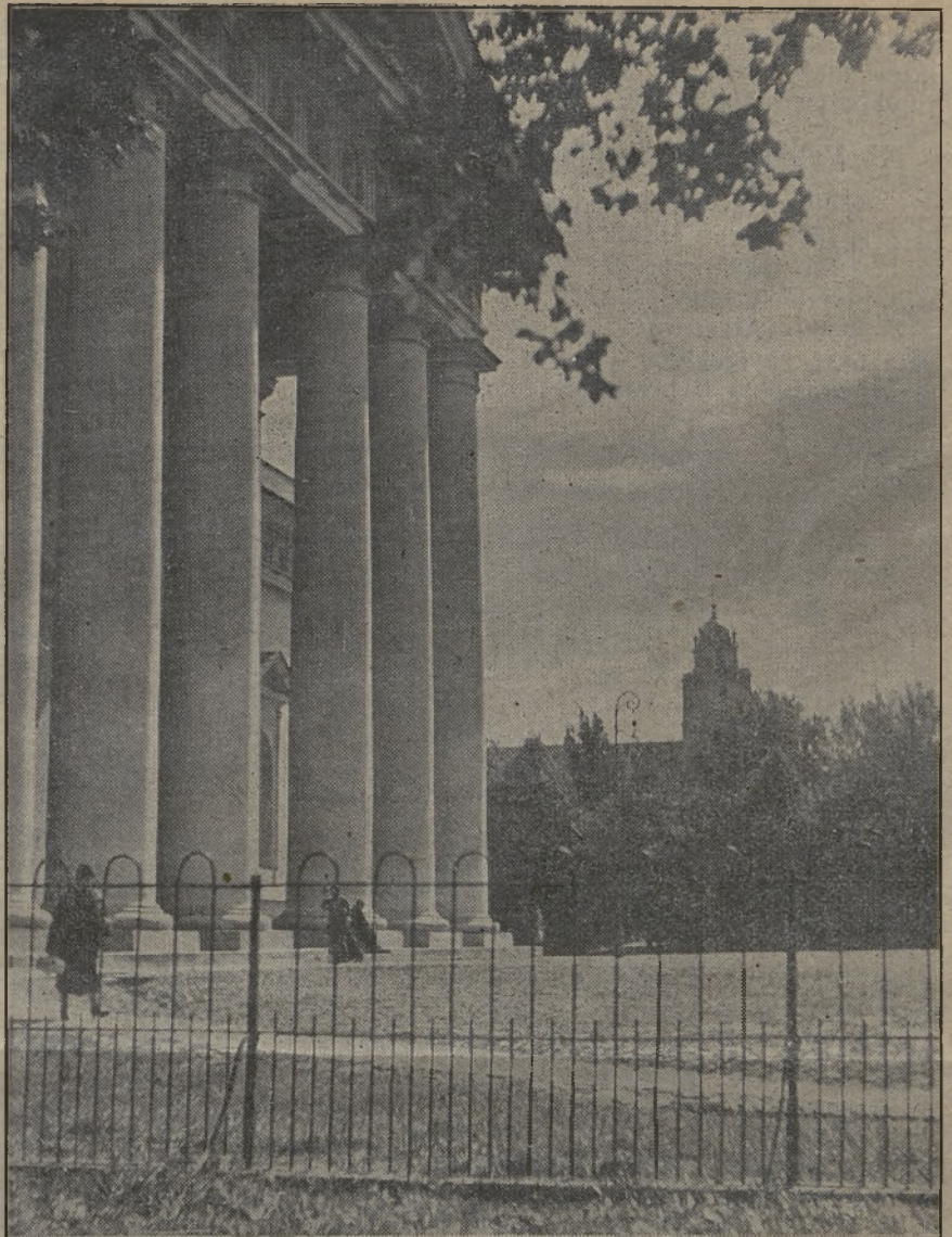
Reginys į šv. Jono varpinę nuo Bazilikos priemūrio.

§ 84. Visoms esamoms Lietuvoje tikybinėms organizacijoms valstybė lygiai pripažįsta teisės tvarkyti taip, kaip jų kanonai arba statutai reikalauja, lai-