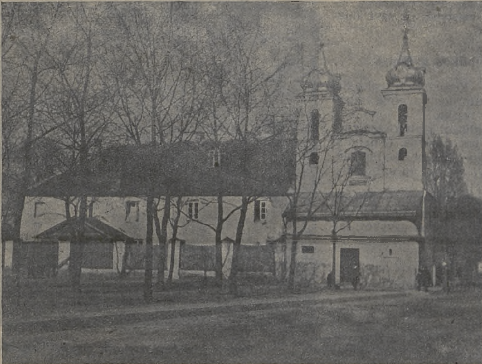
Šv. Kryžiaus bažnyčia, įsteigta 1635 m. atgabenus į čia vienuolius Bonifratrus. Šioje bažny-čioje yra stebuklingas Dievo Motinos paveikslas ir šulnelis.

kurių bendradarbiavimą su vyriausybe, normuojant ūkio gyvenimą, nurodo įstatymas.