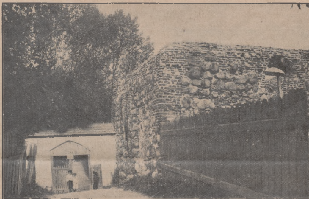
Trakų pilies griuvėsiai. Pilis statyta D. L. Kunig. Gedimino XIV amž. Dar šiandien pilies griuvėsiai liudija apie buvusią Lietuvos galybę.

charakterizuojami mūsų Tautos atstovo darbai, jei jis dar šiandien būtų ministeriu pirmininku. Ateinagalvon pasakėčia primenanti asilo drąsumą prie liūto mirties.