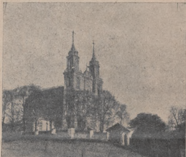
Kalvarijos bažnyčia 'prie Vilniaus.

Raute turėjo būti ir Lenk. Valst. Prezidentas, bet delei nežinomų priežasčių ankščiau apleido Vilnių, tad raute Valst. Prezidentą atstovavo Lenk. Premjeras Švitalskis su Ministeriais. Be to buvo daug įvairios didenybės ir Viln. Universiteto Profesoriai Atsilankiusių svečių skaičius siekė iki 1500 asm.