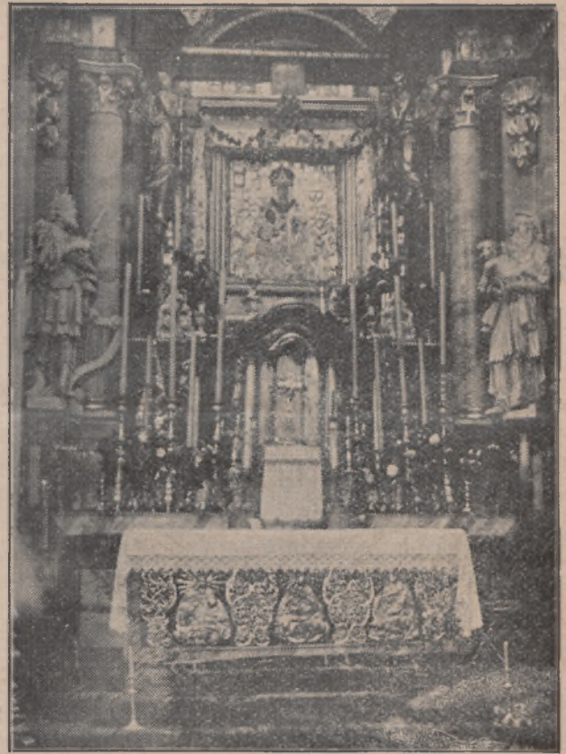
Stebuklingas Šv. P. M. paveikslas Trakų bažnyčioj

Lenkų užsienių reikalų ministrį Zaleskj vakar tarp Varšuvos ir Lovico netoli geležinkelio stoties Ocarow ištiko didelė automobilio nelaimė.