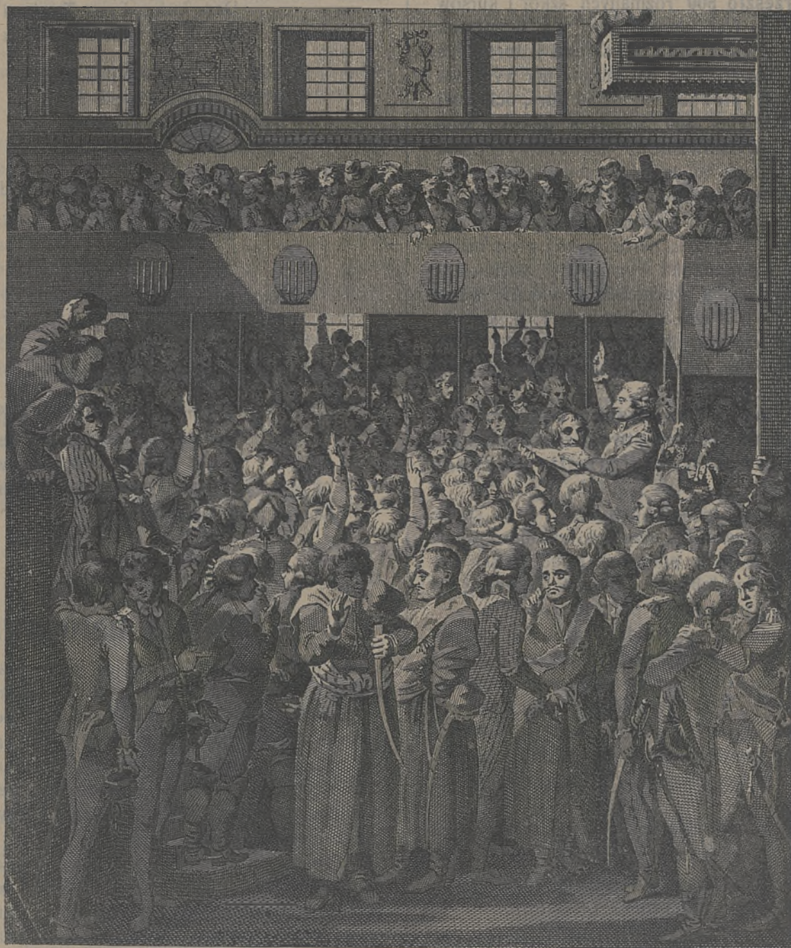
Uchwalenie Konstytucyi 3-go Maja. Przysięga Stanów.