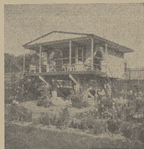
Domek campingowy na przystani Sekcji Turystyki Wodnej P. T. K. w Warszawie.

Poza wymienionymi kapitalnymi pracami, dokonano także, już całkiem z własnych funduszy, cały szereg mniejszych prac i inwestycji, jak: urządzenie pomostu na Wiśle do przybijania łodzi oraz pomostu (narazie prowizorycznego) do przenoszenia łodzi na głębsze miejsce na Wiśle; zapatrzone się w bardzo lekki i precyzyjny wózek do przewożenia łodzi; odnowiono na wiosnę wszystkie budynki, nabyto i zainstalowano (narazie tymczasowo) osadnik betonowy »Bios«, założono telefon dla użytku członków i t. d.