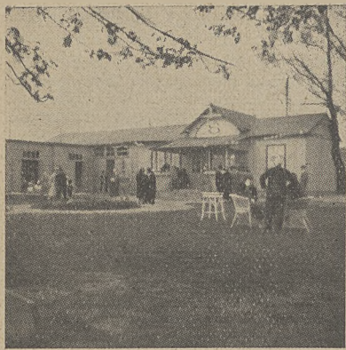
Przystań Sekcji Tur. Wodnej P. T. K. na Wiśle w Warszawie (na lewo widać pierwsze 2 boksy hangaru, zawierającego 10 takich boksów).

wiązki, gdyż nie tylko potrzebę uporządkowania finansów z tytułu dość znacznych i krótkoterminowych zobowiązań, zaciągniętych na budowę i urządzenie przystani, lecz również konieczność usunięcia braków, które, oczywiście, musiały się siłą rzeczy w toku początkującej działalności uzewnętrznić, a więc brak pomostów, wózka do wożenia łodzi, pomieszczenia na odpoczynek, telefonu i t. p. a przede wszystkim brak dostatecznej ilości miejsc na łodzie oraz szafek odzieżowych, któreby umożliwiły zwiększenie ilości członków co najmniej do 100 osób, gdyż przy tej dopiero liczbie sekcja stać się mogła samostarczalną.