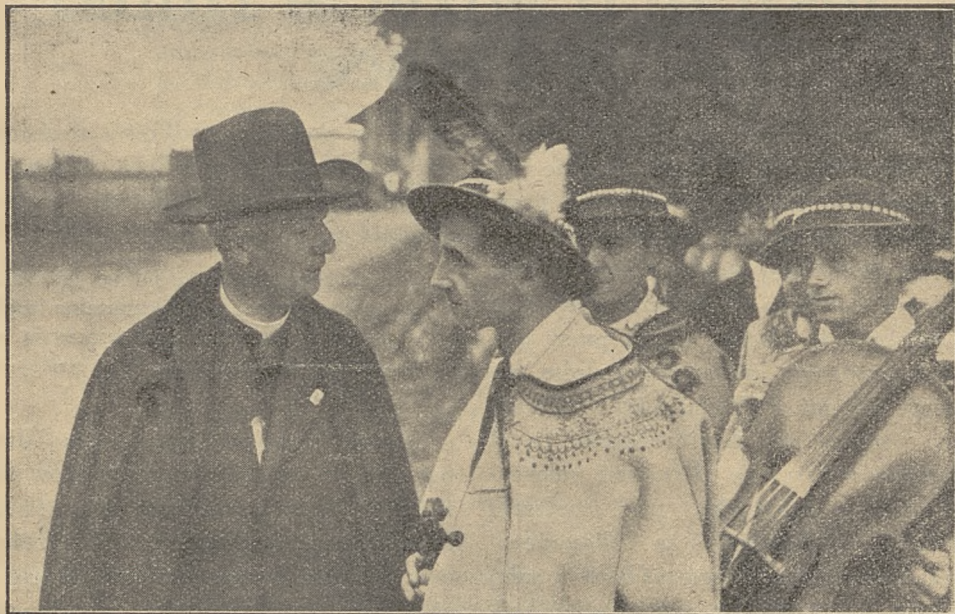
Wódz narodu słowackiego ks. Andrzej Hlinka w rozmowie z zespołem muzyków zakopiańskich.

kie Polacy zgotowali wodzowi Słowaków. „Robotnicze Noviny“ (Nr. 186) też krzywią się na zbratanie polsko-słowackie. Natomiast „Lidove Noviny“, wychodzący w Brnie dziennik stronni-