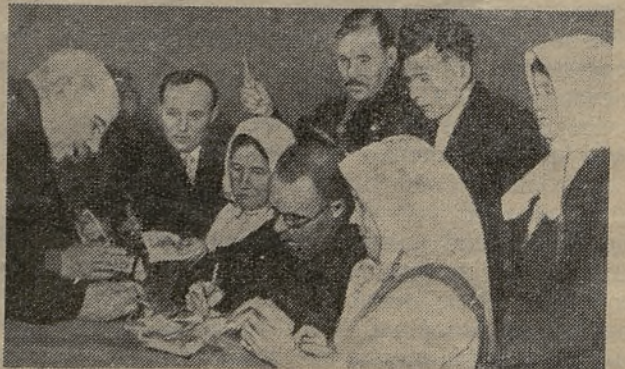
Примусове стягання „добровільних датків“ з українських селян на „світову революцію“. Відомо, що Сталін недавно заявив про смертельну загрозу для ССРСР, якщо вона не вибухне в якнайкоротшому часі.

Перша сесія Верховного Совіту закінчилася дуже весело. На салию засідань увійшли делегації від війська, робітників, селян та інтелігенції, а їхні провідники славословили у своїх промовах Сталіна. — На самий кінець прийшов „товариський обід“ з промовами в честь Сталіна. — От і вся робота Верховного Совіту ССРСР.