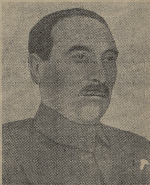
Зліва — Н. С. Хрущев, теперішній перший секретар КП(б)У. На цей пост визначила його Москва 28. І. ц. р. на місце Косіора. Хрущев ще в листопаді 1937 р. ходив у вишиваній сорочці на український зразок, хоч тоді був ще секретарем парт. комітету московської області. Тепер ясно, що Москва отак „українізувала“ Хрущева. — Зправа — нарком земельних справ ССРСР ЕЙХЕ. З його доповіді (11 сторінка „Геть з больш.“) виходить, що сільське господарство ССРСР котиться цілком в пропасть.