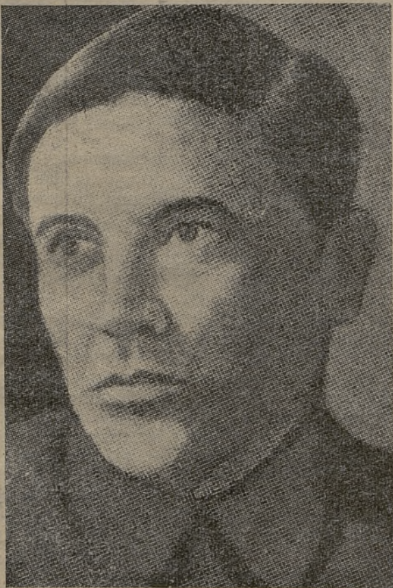
ЄЖОВ — народний комісар внутрішніх справ ССРСР, наступник Ягоди не лиш на пості вождя ГПУ, але й на лаві обвинувачених.

Одначе до того часу московські большевики будуть безпощадно експлуатувати людський гін до збереження життя. Не зважаючи на шалені здирства, визиск населення поневолених країв не хоче поповняти масового самогубства. Воно тримається життя і працює, хоч з