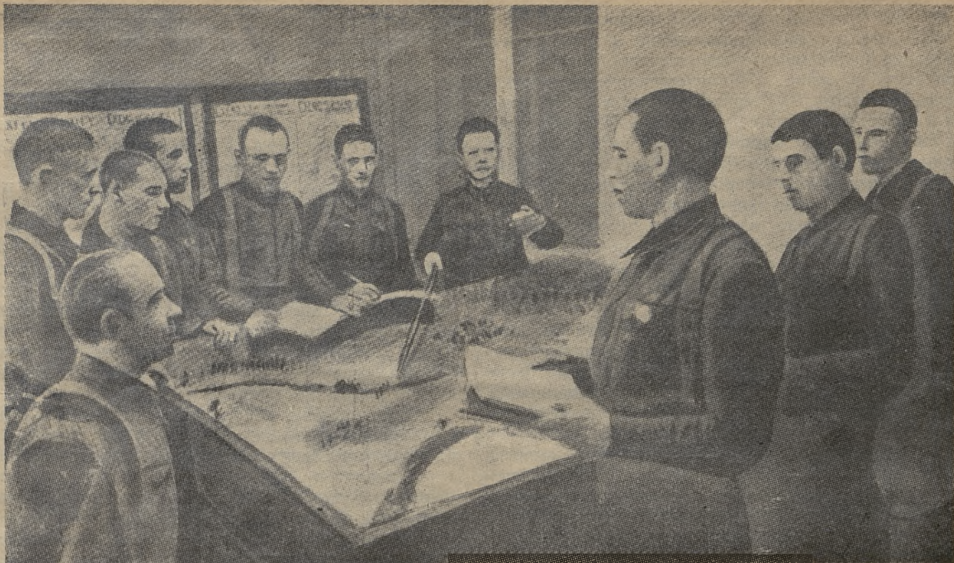
Лекція у військовій школі „пролетарської дивізії“ в Москві. Старшини цієї дивізії хотіли недавно вбити Сталіна та Єжова.