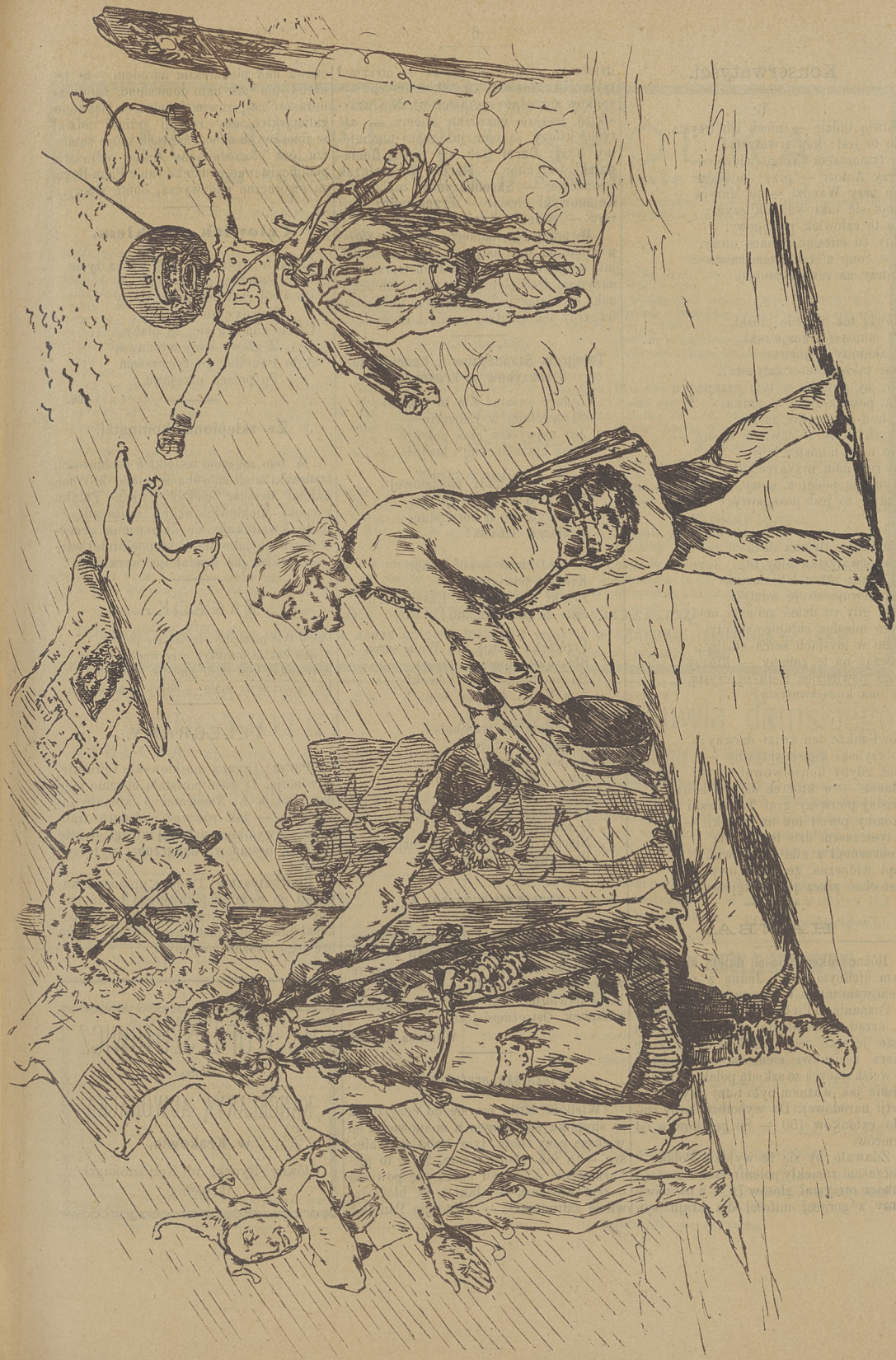
Krakowiak: Witajcie! Czemu chata bogata, tem goścowski rada! Czech: Na zdar! Centralista: Verdfluchter Kerl! Moskal na pograniczu: Ach! sukinsyny! W sybir!