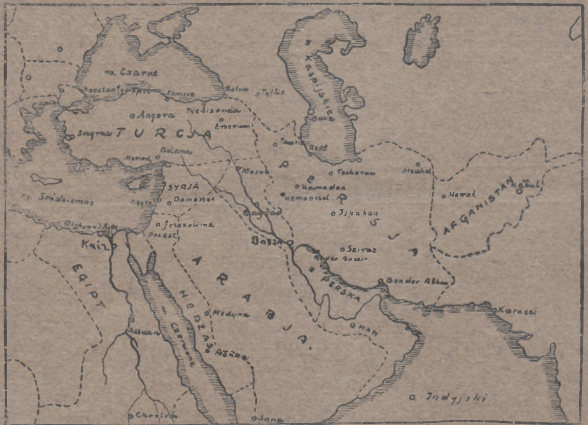
Mapa krajów Bliskiego Wschodu.