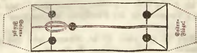
Die Mittellinien bezeichnen den Verschnürungsspagat.

Der Verschnürungsspagat darf nur aus einem Stücke bestehen, und der Knoten desselben in der Mitte der Siegelseite des Couverts anzubringen.