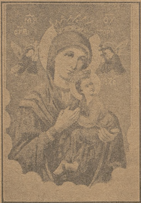
MATKA BOSKA Nieustającej Pomocy.