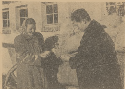
Przed rozpoczęciem siewu w Spółdzielni produkcyjnej w Pisarzowej ob. Hecow i ogromom Zabówka sprawdzają jakość ziarna.