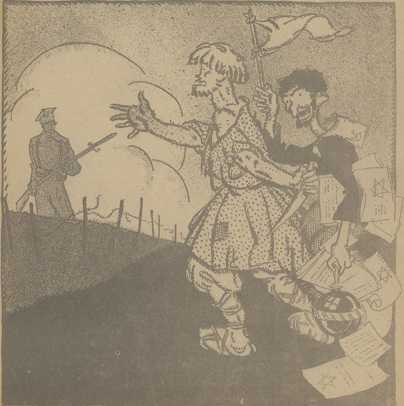
Nu tawarisz! Ty do tego polaka wyciągnij łape na zgode, a ja tymczasem przygotowuje bomby i proklamacje. Niech już raz nareszcie, będzie prawdziwy, bolszewicki pokój.