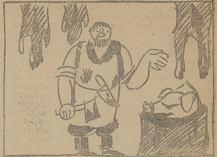
Komisarz spraw wewnętrznych.