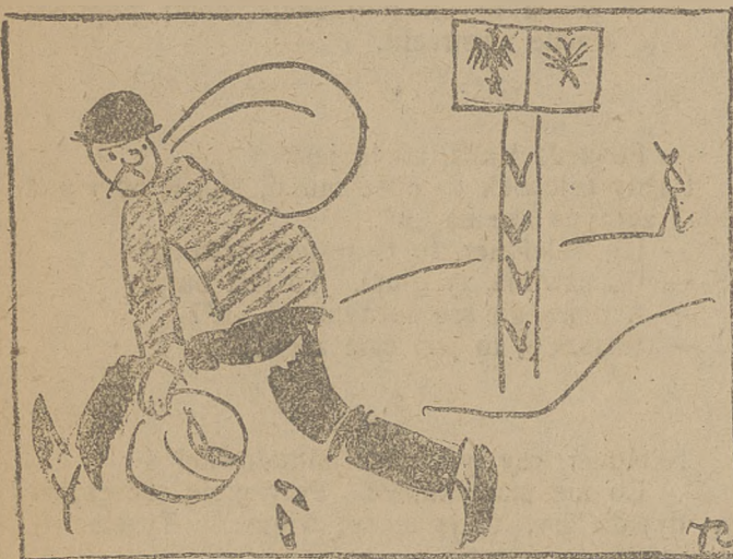
Komisarz spraw zagranicznych.