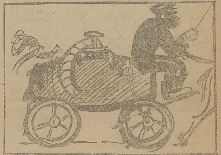
Komisarz zdrowia publicznego.