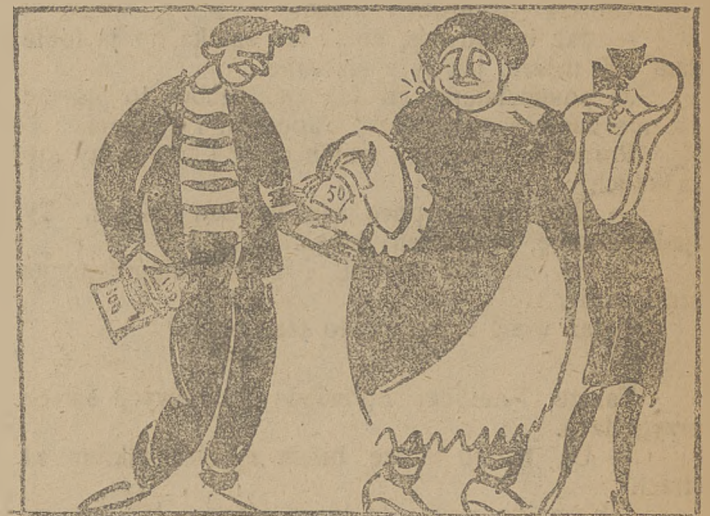
Komisarz przemysłu i handlu.