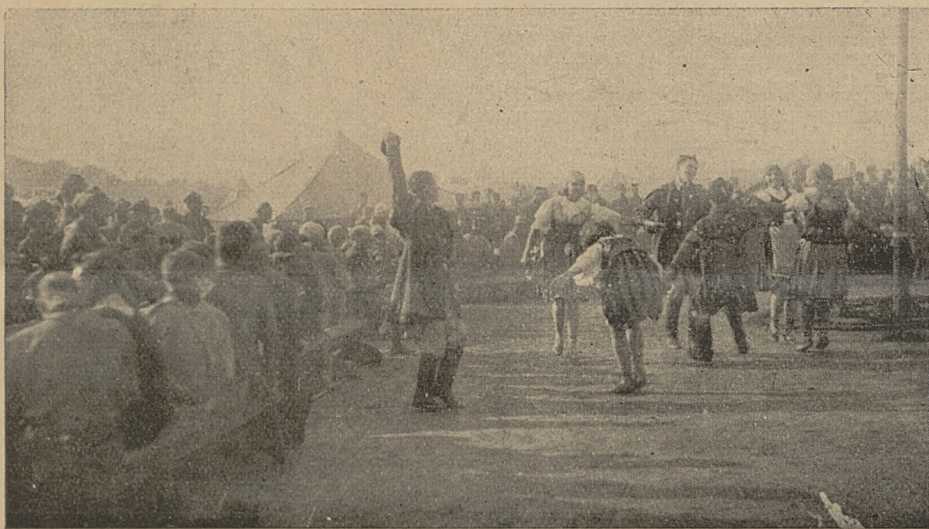
Mazur w obozie polskim na Jamboree podczas przyjęcia dla przedstawicieli wszystkich organizacyj skautowych i hrabstw angielskich.

W Ostendzie kończy się nasza jazda „własnym pociągiem” i mamy przesiąść się na statek, który nas przewiezie przez kanał. Z tem łączy się ciężka praca przeładunku całego naszego sprzętu obozowego. Dobra organizacja pokonywa trudności, druhowie pracują ochoczo, część niezajęta zwiedza miasto i okolice. Grupka