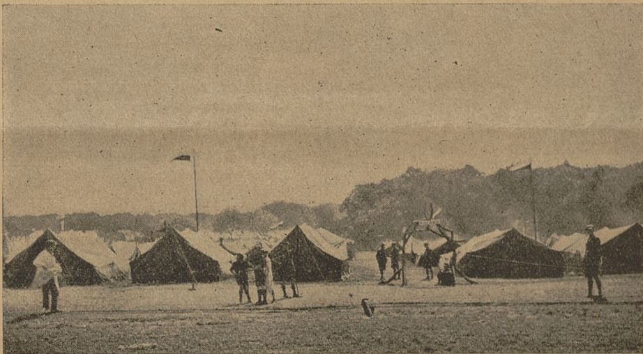
Oboz polski w Arrove Parku.

Ale już Biały Kruk z należąca powagą zasiadł na tronie Wodza, podniósł w górę potężny sękacz, który towarzyszył drużynie na