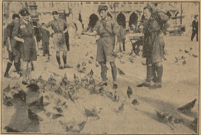
Harcerze na Placu św. Marka w Wenecji.

Następnie Wenecja — cuda pałaców Dozów, muzea, plac św. Marka, słynne gołębie, gondole i kanały niestety tylko w nocy czarujące, gdy w swej ciemnej wodzie odbijają światła, padające z wielkich okien licznych pałaców, w dzień zaś niezbyt efektownie się przedstawiające ze względu na dość duże zasoby przedmiotów w zielonej pływającej wodzie, które nadają jej specyficzny charakter i co gorsze woń niezbyt miłą.