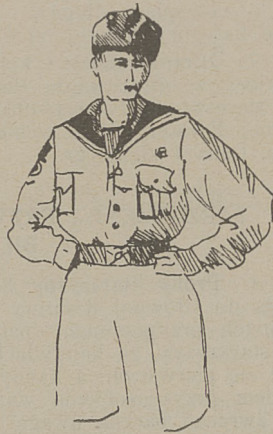
Umundurowanie członków zastępów żeglarskich przy drużynach lądowych (zielona bluza z kołnierzem marynarskim — grana- towym).