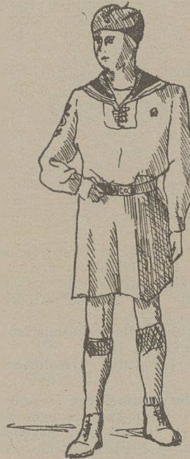
Umundurowanie członków drużyny żeglarskiej (kolor granatowy)