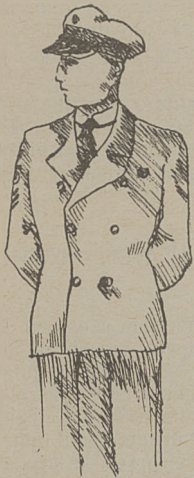
Umundurowanie drużynowego, I i II przyboczego drużyny żeglarskiej.