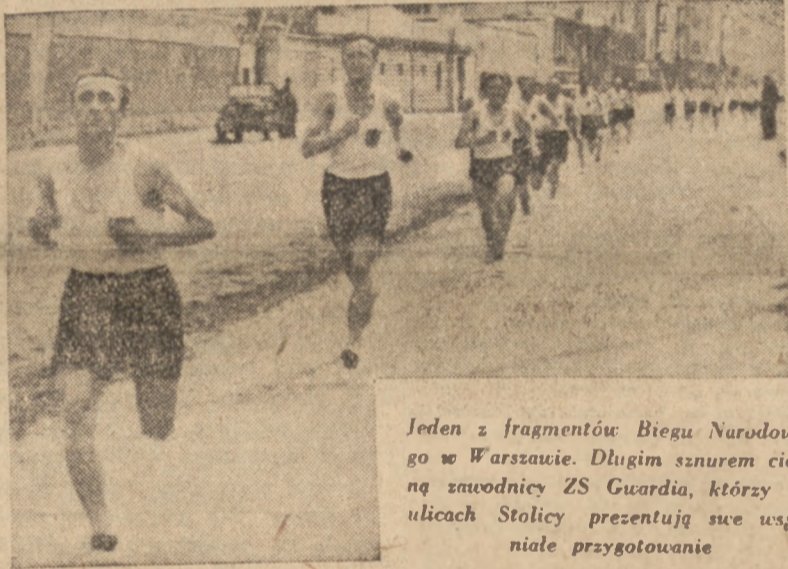
Jeden z fragmentów Biegu Narodowego w Warszawie. Długim sznurem ciągną zawodnicy ZS Guardia, którzy na ulicach Stolicy prezentują swe wyspiarskie przygotowanie

W drużynie jest tylko 3 zawodników z meczu warszawskiego.