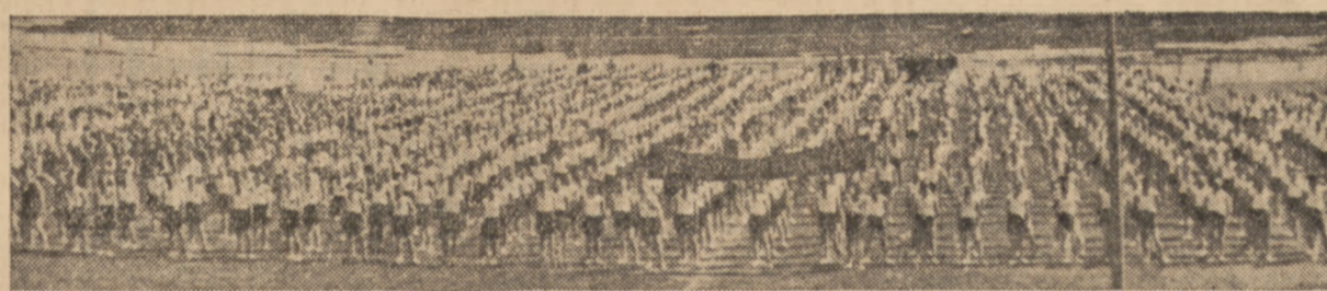
Masowy udział w Biegach Narodowych miał również miejsce w stolicy Polski. Oto fragment zbiórki zawodników na Stadionie WP w jednym z 6 Biegów Narodowych rozegranych w Stolicy, w biegu organizowanym przez dzielnicę Warszawa - Śródmieście