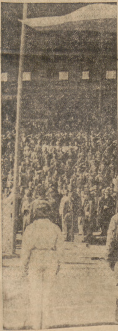
Drugi maja 1948 roku. Godzina 11.59. Flaga państwowa uciągnięta na maszcie Stadionu WP jest sygnałem do rozpoczęcia Biegów Narodowych w całym kraju

WROCLAW, 2.5. (tel. wł.). Wspaniale zwycięstwo polskich kolarzy w drugim dniu wyścigu Warszawa - Praga jest jednym z największych triumfów polskiego kolarstwa.