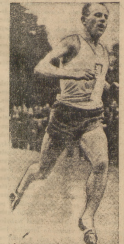
Słynny czechosłowacki biegacz Zatopek po swym uspaniałym ostatnim biegu na 10.000 m. staje się na tym dystansie najpoważniejszym kandydatem do złotego medalu w Londynie.

PRAGA, 20.6. (tel. wł.). W mistrzostwach ligi czechkiej padły następujące wyniki: Ostrawa - Sparta 4:4 (4:2), Czeskie Budziejowice - Jednota Kozsycze 5:3 (2:0), Trnava - Victoria Pilzno 5:2 (2:0).