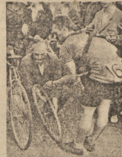
Czech Pavel rozpoczął serię defektów, które już na pierwszym etapie dały się mocno we znaki kolarzom.