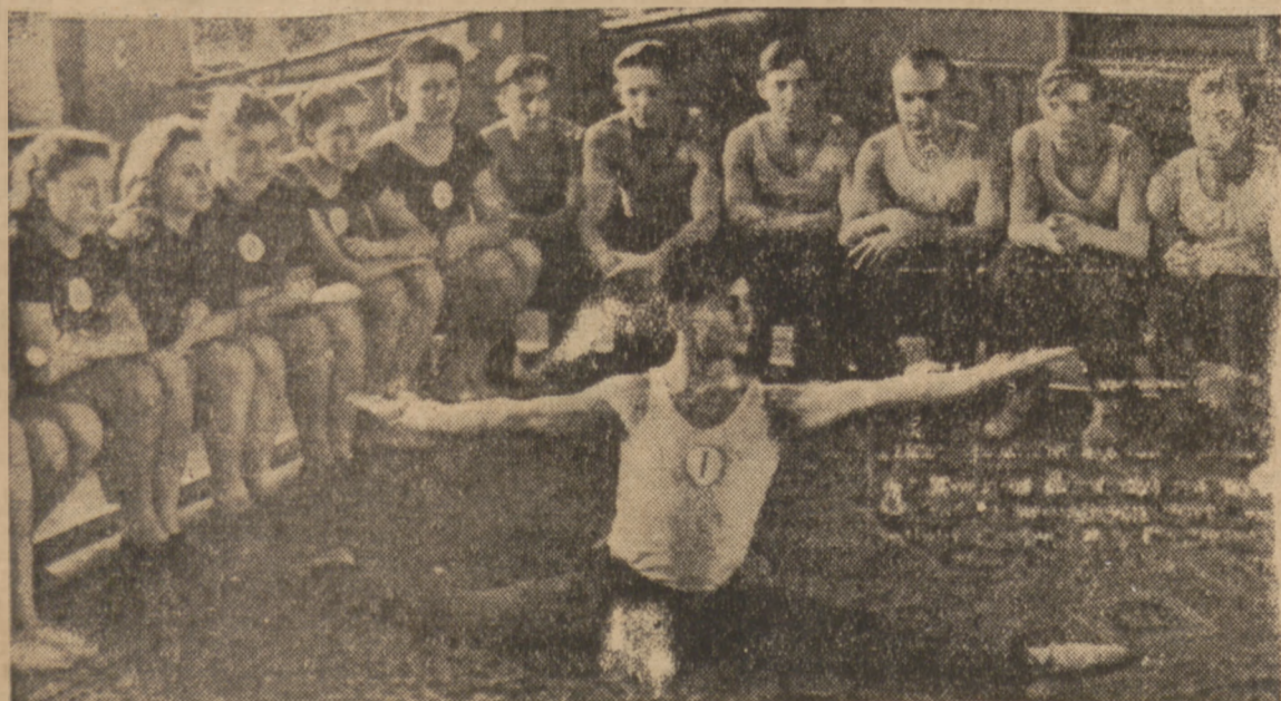
Sluchacze i sluchaczki moskiewskiego Instytutu Pedagogicznego s mierzoscami idędq pokus przodownika ćwiczeń

Przewiduje się następujące punkty startu wozów: Florencia, Mediolan przez Bern do Monte - Carlo, 2) Glasgow, Doncaster, Falkstone, Boulogne przez Luxemburg do Monte-Carlo, 3) Lizbona, Madryt, St. Sebastian, Bordeaux, Turs, Reims do Monte - Carlo, 4) Oslo, Helsingburg, Kopenhaga, Odense, Hamburg, Hongolo, Amsterdam itd., 5) Praz, Innsbruck, Ulm, Strassbourg itd. 6) Sztokholm, Jonkoping, Helsingburg, Kopenhaga, Odense, Hamburg, Honolo, Amsterdam itd.