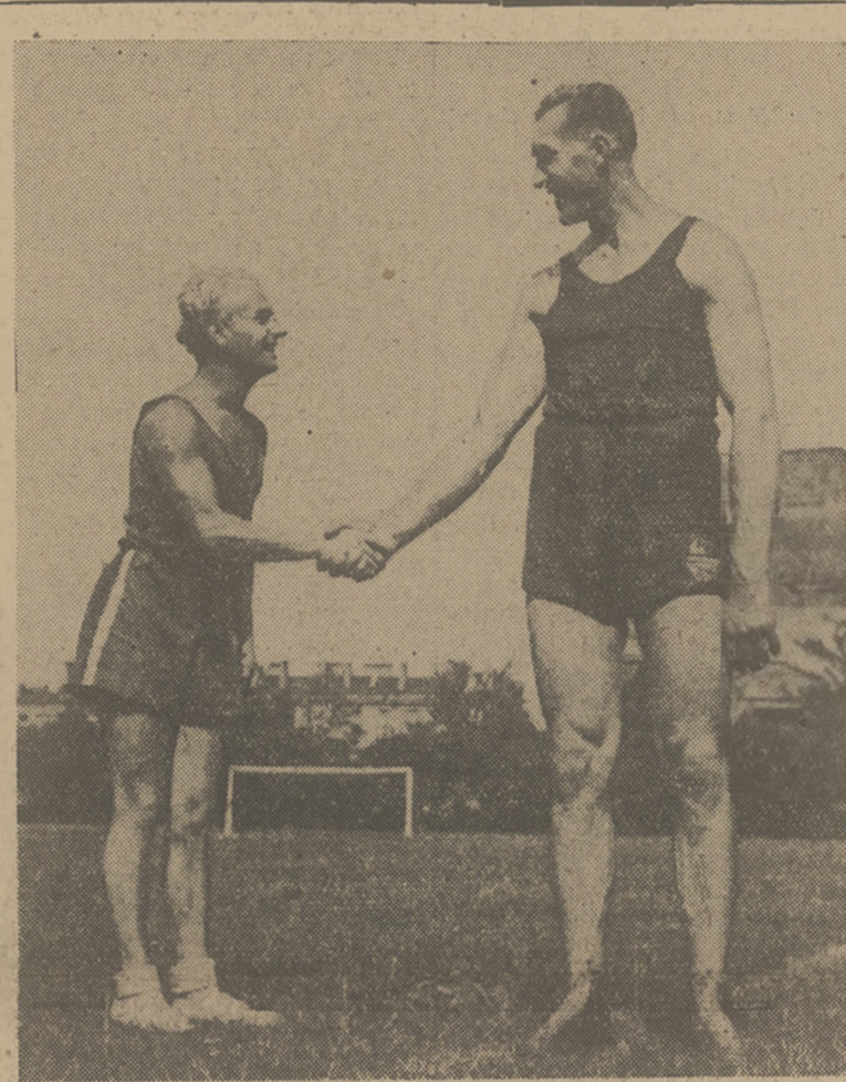
Duda już dziś przerzosta o trzy glo... Ważni mistrza Europy Kasperczaka... Czy jego wyniki będą proporcjonalne do wzrostu — okaże się

Jak się w ostatniej chwili dowiadujemy, walne zebranie PZPN, wyznaczone na dzień 17. IX zostało odwołane. Nowy termin zebrania nie został jeszcze ustalony.