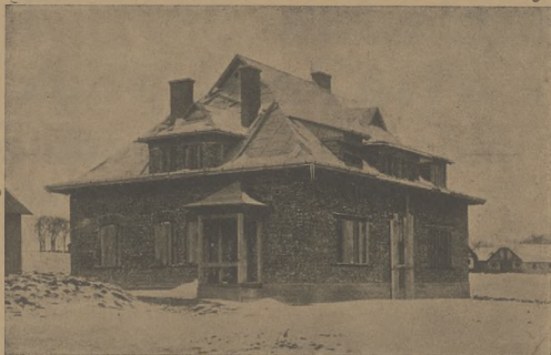
Dom Ludowy T. S. L. w Potoczku, powiat Śniatyn.