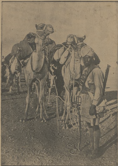
Uzbrojeni żołnierze strzegą granicy kolonii angielskich w Afryce północno-wschodniej.