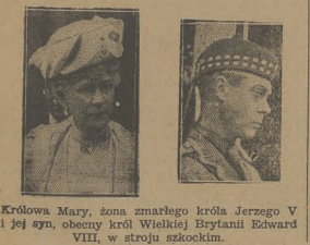
Królwa Mary, żona zmarłego króla Jerzego V i jej syn, obecny król Wielkiej Brytanii Edward VIII, w stroju szcokkim.