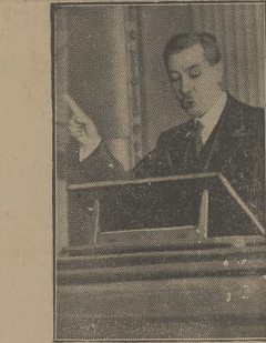
Inż. E. KWIAWKOWSKI wicepremier i minister skarbu.