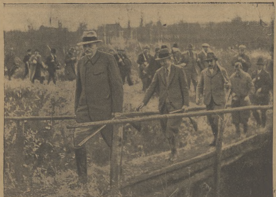
Pan Prezydent Rzeczypospolitej prof. Mościcki na czelu myślących na polowaniu reprezentacyjnym w Komorzce Cieszyńskiej.