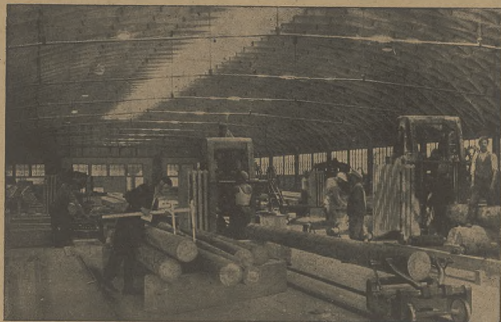
Praca w Tartaku Państwowym w Worochcie.

Przed kilku dniami uruchomiony został Tartak państwowy w Worochcie, gdzie znalazło zatrudnienie 200 robotników.