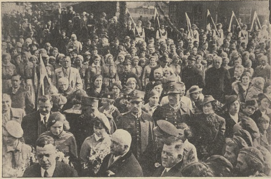
Młodzież szkolna, licznie zebrane społeczeństwo, przedstawiciele władz i delegaci Komitetu Obywatelskiego witają wycieczkę młodzieży bułgarskiej na stacji kolejowej w Śniatynie. Z zewnątrz w dniu 28 kwietnia b. r. Na zdjęciu moment powitania gości bułgarskich przez delegata komitetu miejscowego.

haterskiego króla Władysława Warneńczyka. Głosem wzniesiono piękny album, przygotowany przez młodzież Państwowego gimnazjum w Śniatynie, tudzież kwiaty. Żywiołowe okrzyki na cześć Bułgarii, odpowiadanie przez tłum młodzie-