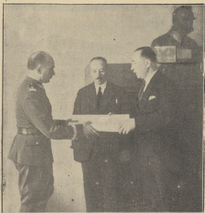
Specjalna delegacja wjechała ministrowi spraw wojskowych gen. Tadeuszowi Kasprzyckiemu dyplom honorowego obywatela Augusta.