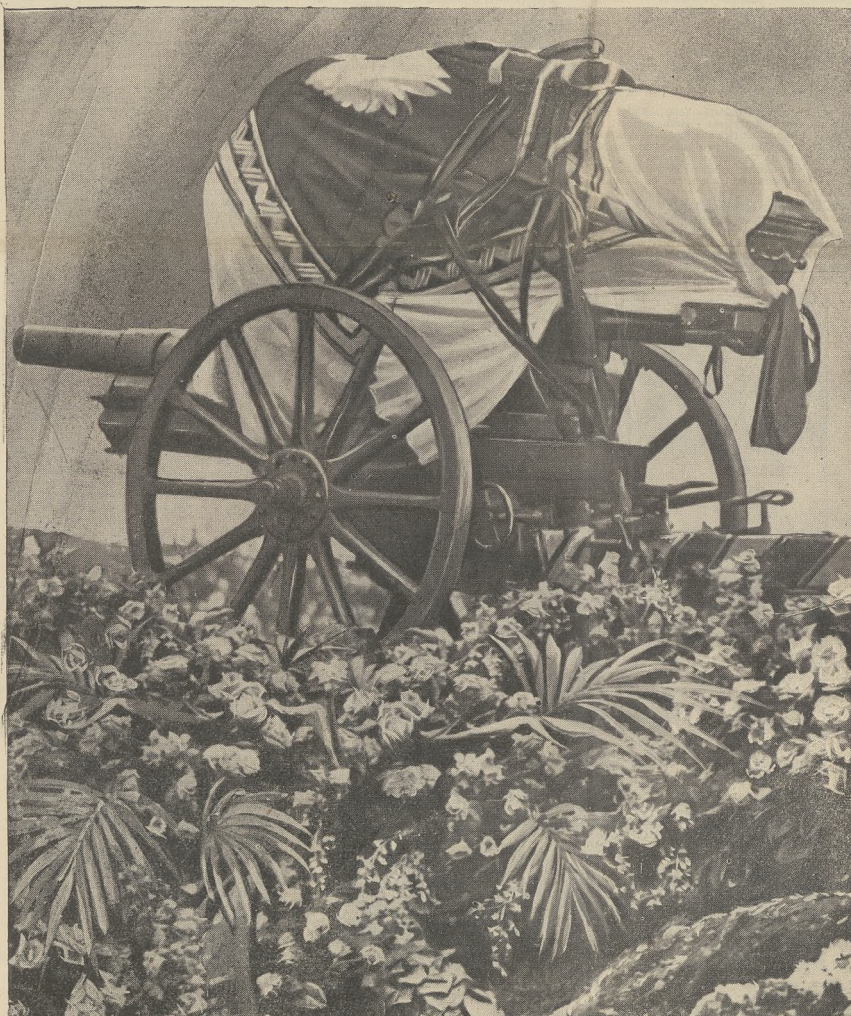
Truma Marszałka Józefa Piłsudskiego, złożona na lawecie armatniej pokryta sztandarem Rzeczypospolitej, ustawiona była przed dwoma laty na Polach Mokotowskich. Cała Armia polska przeddefilowała wówczas po raz ostatni przed Pierwszym Marszałkiem Polski.

Wydział wykonawczy Naczelnego Komitetu Uczczenia Pamięci Marszałka Józefa Piłsudskiego wydał dla komitetów wojewódzkich następującą instrukcję w sprawie obchodu drugiej rocznicy skonu Marszałka Piłsudskiego w dniu 12 maja: