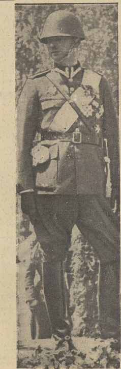
Król rumuński Karol II w mundurze polskiego pułkownika.