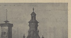
Włoch na Ratusz i Katedre we Lwowie.

Ta jednostronna struktura gospodarcza Polski nie odpowiada jej dzisiejszym potrzebom i wymaga przemiany. Musimy natomiast nutandis przebyć tą drogę, którą kraje zachodu przebyły w ciągu XIX wieku, by osiągnąć pełny i wszechstronny rozwój naszych narodowych sił gospodarczych.