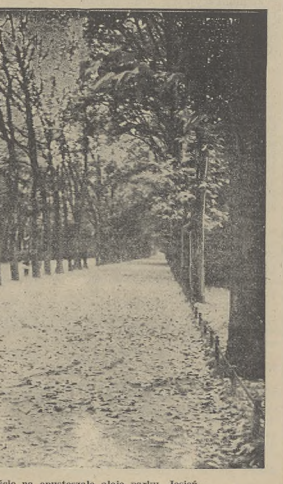
Opalaty liście na opustoszałe aleje parku. Jesień...

Przedstawia Lwów do odgrywania również i w przyszłości tej wielkiej roli, jaką odgrywał w historycznej Rzeczypospolitej.